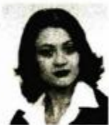
Razgovarala: Daliborka ĐURIŠIĆ