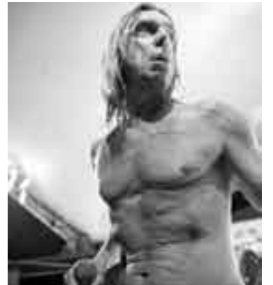
Iggy Pop.

Pero si bien eso pasó sin mayores dilemas, ahora la Iguana se las arregló para irritar a buena parte de los músicos ingleses al protagonizar una serie de spots televisivos para la compañía de seguros Swiftcover.com . No es la primera vez que Pop presta su peculiar estampa a alguna publicidad, pero ésta en particular tiene una característica irritante: Swiftcover.com específicamente no asegura músicos. Un portavoz de la compañía declaró que se había ele-