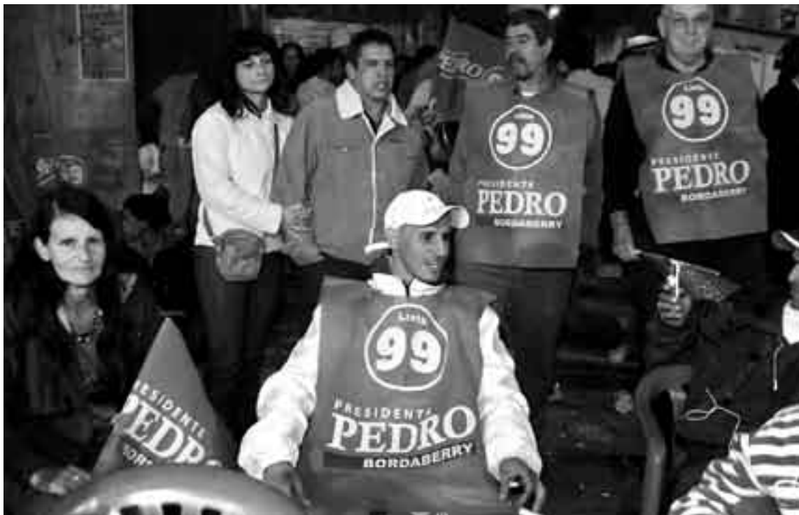
Participantes en el acto de la Lista 99, anoche.

Y continuó: "Recuerdo que uno de los fundadores, Renán Rodríguez, queriendo explicar el ánimo que vivía el partido dijo: 'vinimos a dar un sacudón al bat-