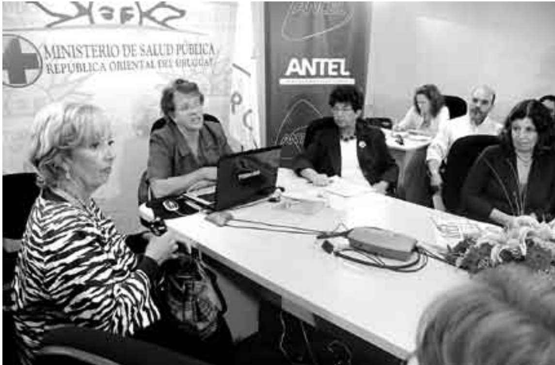
Inauguración de la sala de videoconferencias del MSP y presentación de la guía de abordaje a las situaciones de violencia hacia las mujeres en el sector de la salud. * FOTO: FERNANDO MORÁN

La creación de una guía por parte del Programa Nacional de Salud de Género del MSP no es casual. Cabe recordar que el año pasado un estudio del Área de Condición del Varón del Programa Nacional de Salud de la Mujer y Género del MSP, realizado por profesionales de distintas áreas, determinó que la mayoría de los hombres de las instituciones de salud que están en contacto con esta temática no tiene conciencia de los orígenes socioculturales de este problema. El estudio, realizado con 27 médicos y cinco profesionales no médicos, constataba que los hombres ven a la violencia doméstica como un crimen desconectado de la cultura patriarcal aprendida por todos.