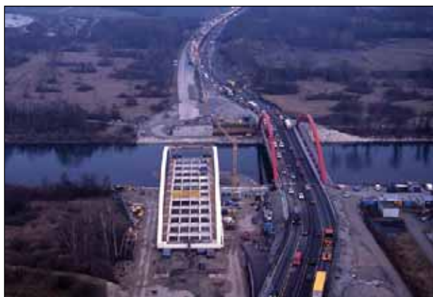
Neubau der Lechbrücke