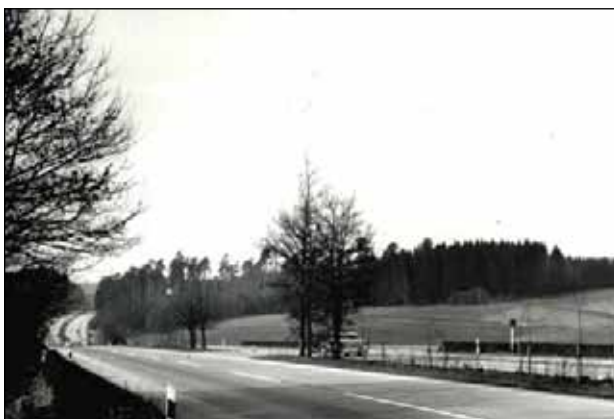
A8 bei Hadersried im Jahr 1960

Über die Mauteinnahmen hinaus, welche dem Konzessionsnehmer