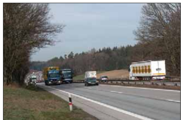
A8 bei Hadersried im Jahr 2007