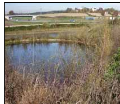
Regenrückhaltebecken am Parkplatz Fuchsberg