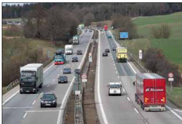
A8 bei Adelzhausen

Die Verhandlungen mit den bevorzugten Bietern wurden von einem ebenfalls institutionenübergreifend besetzten Verhandlungsteam geführt. In drei Runden wurde mit beiden bevorzugten Bietern jeweils separat verhandelt. Gegenstand war vor allem der vom jeweiligen Bieter angemeldete Verhandlungsbedarf. Ziel der Verhandlungen war, eine optimale Risikoverteilung bei gleichzeitig