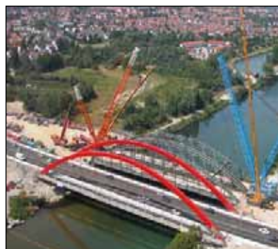
Bau der Lechbrücke