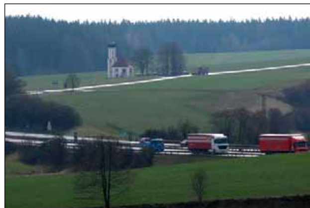
Kapelle St. Salvator, Adelzhausen