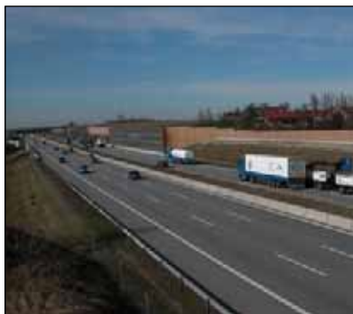
Lärmschutzwand bei Palsweis

Die im Abschnitt Augsburg – München vorhandenen zwei Fahrstreifen je Fahrbahn haben jeweils eine Breite von 3,75 m mit angrenzenden Randstreifen von 0,5 m und 1,5 m. Auf der gesamten Abschnittslänge sind fast keine Standstreifen vorhanden, auf kurzen Abschnitten wurden nur Nothaltestreifen nachträglich angebaut. Für den Ausbau der A8 im Konzessionsabschnitt ist nunmehr durchgängig ein Querschnitt mit sechs Fahrstreifen und zwei Standstreifen vorgesehen, der insgesamt 35,50 m breit ist.