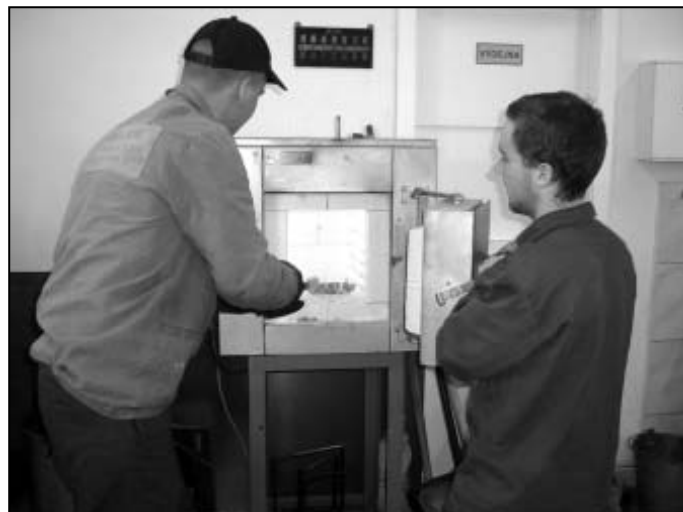
Žáci učící se oboru nástrojař se dostávají při tepelném zpracování oceli do styku i s kalící pecí.

ná výchova za uplynulý ročník, kdy žáci ohodnoceni známkou jedna obdrží v prvním ročníku jednorázově 1000 Kč, ve druhém 2000 Kč a ve třetím 4000 Kč. Žáci, kteří budou ohodnoceni dvojkou, si odnesou 500 Kč, 1000 Kč resp. 2000 Kč. Tato stipendia vyplácená třikrát v roce, a to v prosinci, březnu a červnu ovšem nedostanou žáci, kteří budou mít neomluvenou absenci nebo důtku ředitele školy. Další podmínkou pro