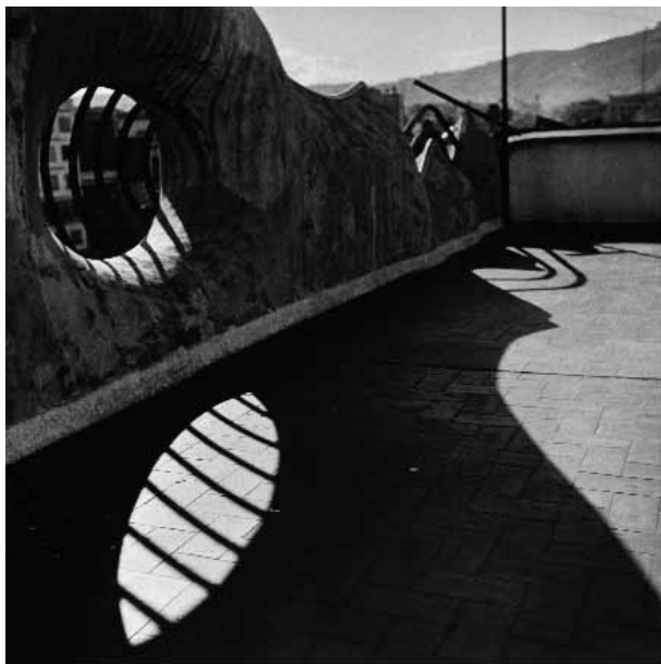
CASA BATLLÓ (Barcelona) Baranda de la azotea. Detalle Gelatina de plata. 50 x 50 cm