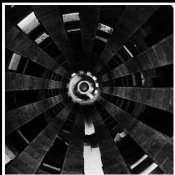
TEMPLO EXPIATORIO DE LA SAGRADA FAMÍLIA (Barcelona) Campanario. Interior Gelatina de plata. 50 x 50 cm