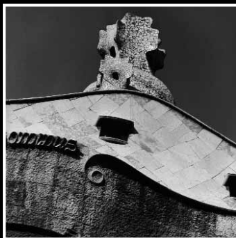
CASA MILÀ. LA PEDRERA ( Barcelona ) Puerta de entrada por la calle Provença. Detalle