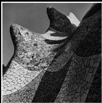
PARC GÜELL (Barcelona) Cubierta de uno de los pabellones de entrada. Detalle Gelatina de plata. 50 x 50 cm