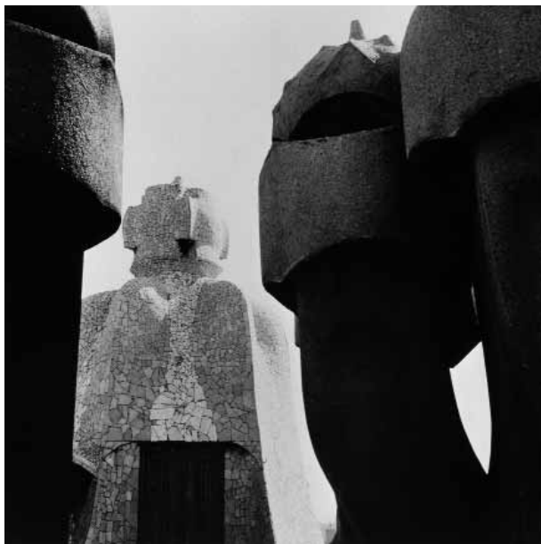
CASA MILÀ. LA PEDRERA (Barcelona) Caja de escalera y chimeneas de la azotea. Detalle Gelatina de plata. 50 x 50 cm