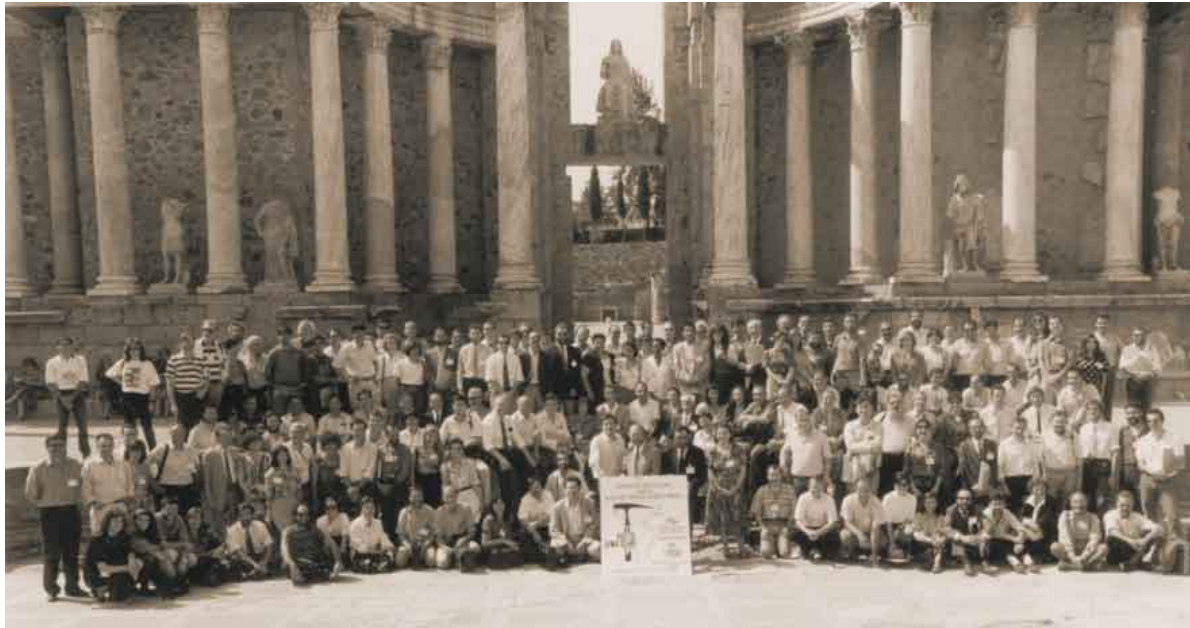
Geólogos participantes en la Conferencia Internacional sobre el Paleozoico Inferior de Ibero-América. Extremadura Enclave 92.

Asimismo era Director Facultativo de numerosos recursos de agua mineral donde destacan: “Agua del Rosal” en Calera y Chozas (Toledo), “Agua Sierra Fría” en Valencia de Alcántara (Badajoz), “Agua de los Riscos” en Alburquerque (Badajoz), etc.