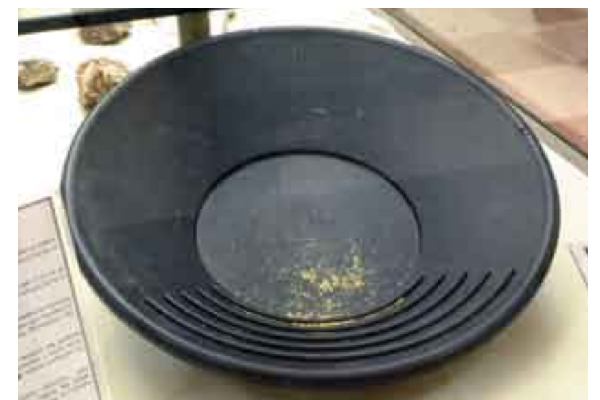
Batea con muestras de oro. (M.G.E.)