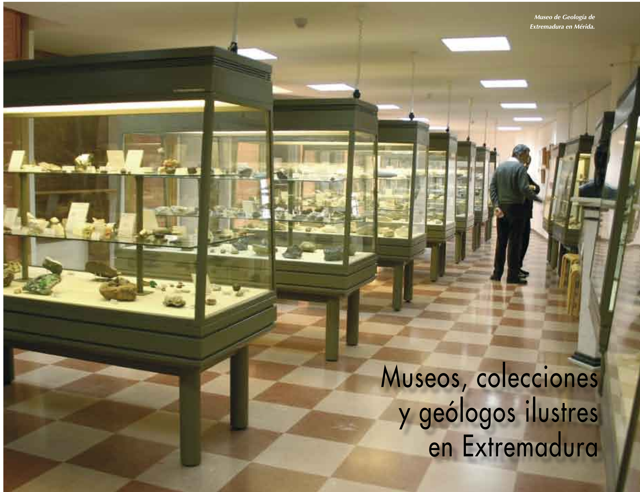
Museo de Geología de Extremadura en Mérida.

El actual museo se estructura en dos salas, en la Sala I se muestra de una forma sistemática una cla-