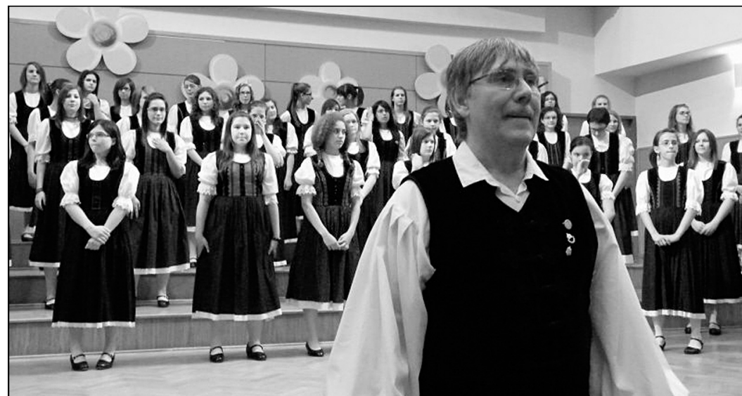
... és fellépésén

Az éneklő Magyarországot! Magam nem találkoztam Kodállal, hivatalosan még a módszert sem tanultam. Véletlenül csöppentem bele, és egy elképzelhetetlen világ nyílt ki előttem. Ezért önzetlenül szeretném ezt a csodát másoknak is megmutatni, hogy erőt kapjon belőle, és a maga tehetségével, a maga helyén próbálja ugyanazt megcsinálni. Hiszünk abban, hogy az éneklő ember boldog ember, és azt szeretnénk, hogy a mi példánkból tanulva mások is úgy gondolják, érdemes azért dolgozni, hogy minél több boldog éneklő embert neveljünk föl.