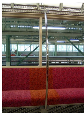
第12編成車両1312号車の縦手すり設置状況