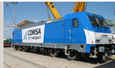
TRAXX (3) 5.200 Kw. – Ancho ibérico