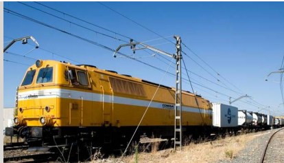
MZ III (2) 3.965 CV – Ancho UIC y Ibérico