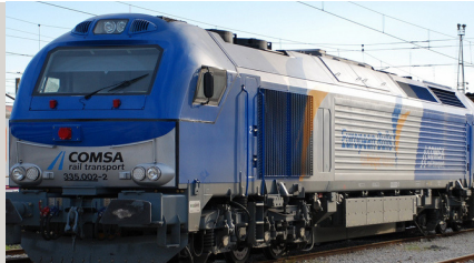
EURO 4000 (3) 4.000 CV – Ancho ibérico