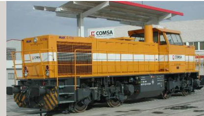
G 1700 (2) 2.040 CV – Ancho UIC y Ibérico