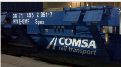
VAGONES PLATAFORMA 60 Pies – Ancho ibérico (106)