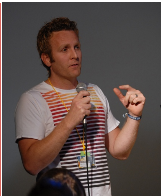
Soulnet: "Equipping (young) leaders to make a change."

Soul Survivor zet de deuren van haar festival elk jaar één dag gratis open voor jeugdleiders, voorgangers en jongerenwerkers. Soulnet heeft deze doelgroep (een paar honderd bezoekers) opgevangen en zoveel mogelijk ontmoet. Dit is een belangrijk moment voor Soulnet, omdat het de doelgroep inzicht geeft in wat er op het festival gebeurt en waar ze hun jongeren eventueel in komende jaren mee naartoe kunnen nemen.