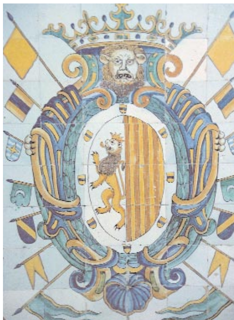
Heráldica de los Duques de Arcos. ▲ Iglesia de San Pedro Mártir.

El recinto rodea y enmarca el antiguo y medieval Barrio de San Juan. Tenía cua-