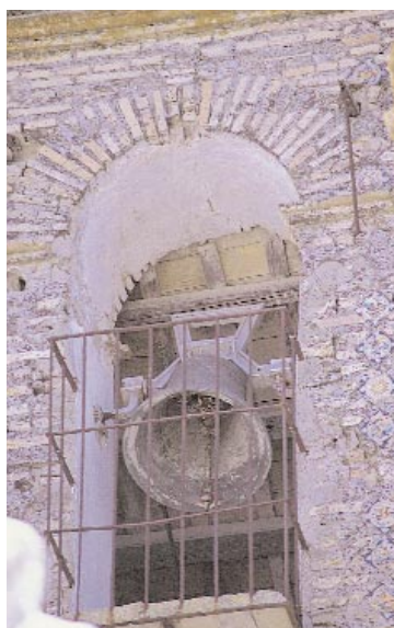
Detalle de espadaña del Convento de la Inmaculada Concepción. ▲

El abandono del recinto fue casi inminente después de la reconquista de la ciudad a la vez que el musulmán fue