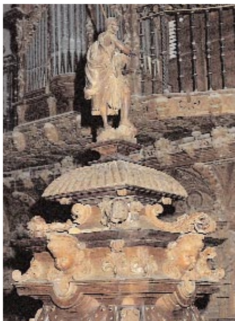
Detalle de Coro de la Iglesia de San Juan Bautista. ▲

Tiene tres naves, la central de mayor longitud que las laterales y una transversal, dando planta de cruz latina. En la intersección de ellas se encuentra una cúpula con linterna.