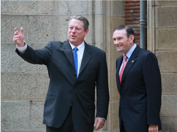
El lehendakari Ibarretxe y el Premio Nobel de La Paz y ex vicepresidente de EEUU, Al Gore, a su llegada al museo Guggenheim de Bilbao.

El Premio Nobel de la Paz y ex vicepresidente norteamericano, Al Gore, valora la manera en la que Euskadi aborda el momento de crisis financiera global y de crisis climática "más grave aún" vía innovación e inversión en energías renovables.