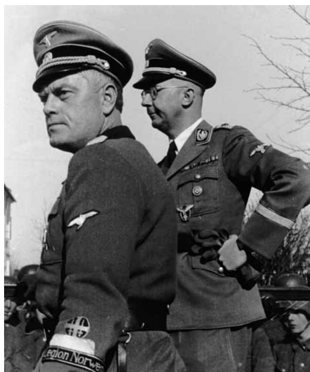
Jonas Lie og Heinrich Himmler.