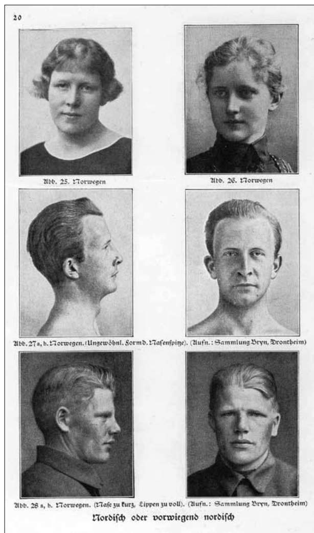
Den nordiske rase. H. F. K. Günther: Kleine Rassenkunde Europas (München, 1922)

med faglige spørsmål til Bryn. Etter hvert ble han imidlertid mer av en rådgiver for Bryn, og kom med forslag om hvor han burde publisere og hvilken faglitteratur han burde lese. 44