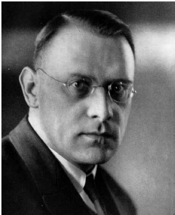
Den nordiske tankens ideolog: Hans F. K. Günther (1891 – 1968). Kilde: Der Norden. Monatsschrift der Nordischen Gesellschaft, 18. år, nr. 3, 1941.