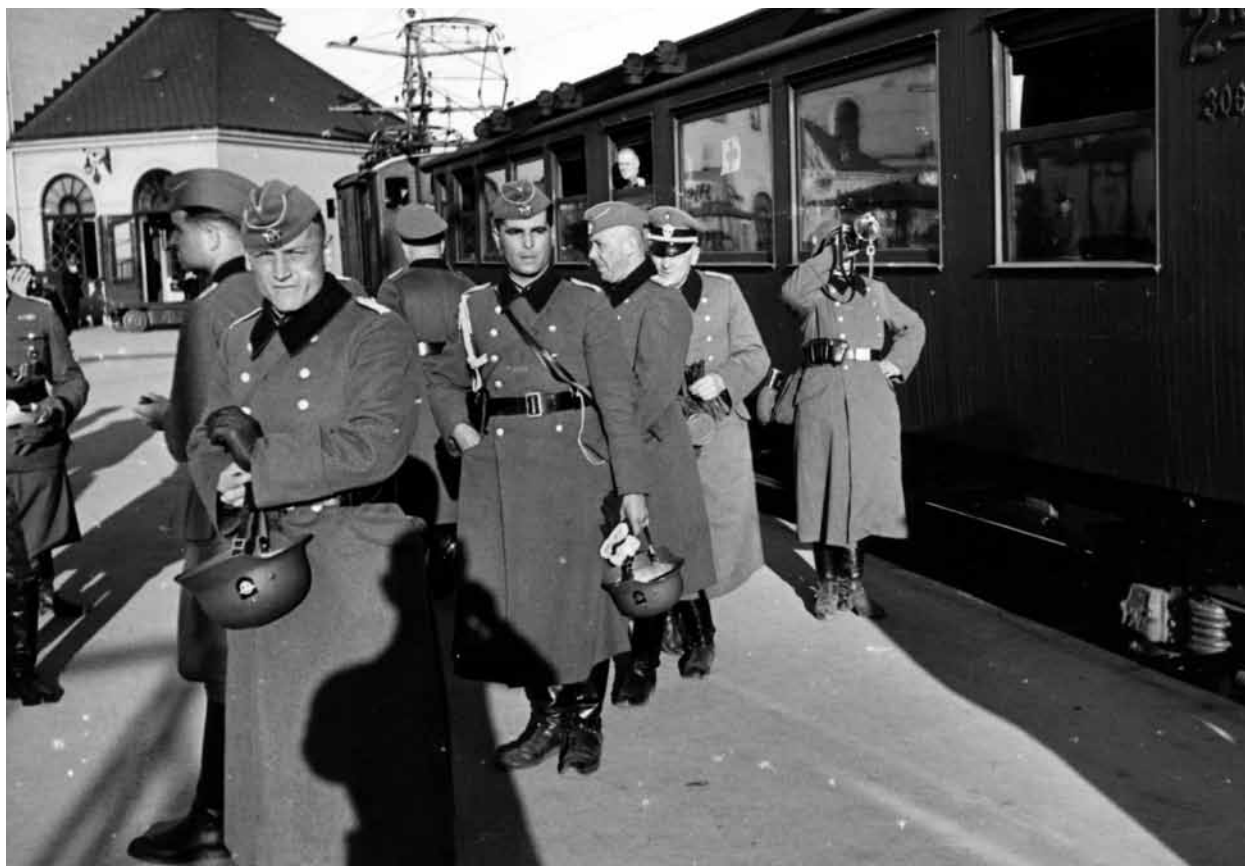
Vestbanehallen: Medlemmer av Polizei-Bataillon 9 ankommer Oslo, mai 1940. Disse mennene skulle senere delta i masse mord på titusener av sivile i Øst-Europa.

Orpo i Norge hadde ”en lang rekke politioppgaver, først og fremst grensepatruljering”. 31 I 1940 inkluderte imidlertid Orpos ”politioppgaver” – også kjent som ”sikkerhetsoppgaver” – også implementering av folkemordspolitikken i andre okkuperte områder. Under kampanjen i