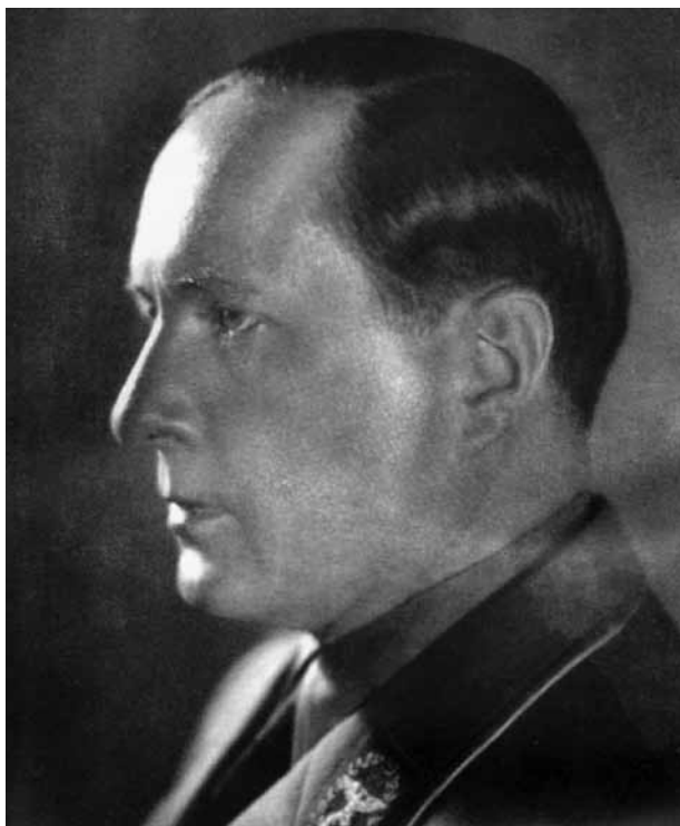
Richard Walther Darré (1896–1953).

fjernt fra den korrupperende storbyen etter mønster av den tidligere völkische kollektivbevegelsen. 13