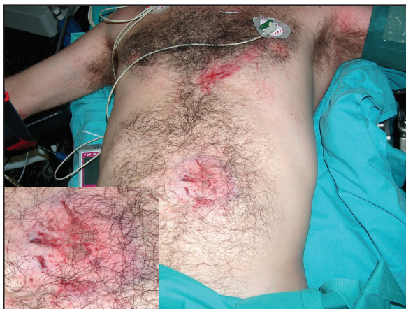
Figura 1. Imagen del paciente en la que se observa la aparente integridad de la pared abdominal. En el recuadro (abajo a la izquierda) detalle de la zona contundida, con equimosis y erosión pero sin solución de continuidad de la piel.

Con el diagnóstico de evisceración contenida como consecuencia de una cornada envainada, se decidió la intervención quirúrgica urgente. Durante la misma se comprobaron los hallazgos de la TC sobre la pared abdominal (evisceración), se revisaron los órganos abdominales según la sistemática habi-