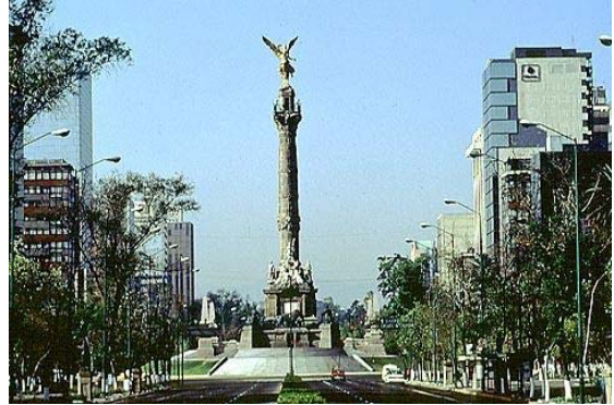
MÉXICO. D. F.