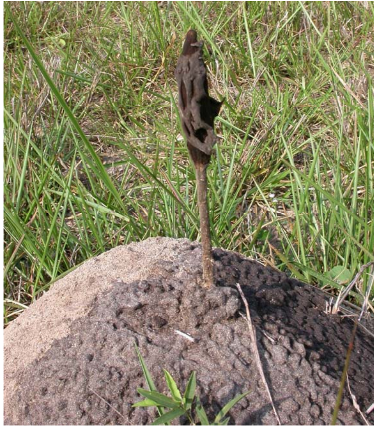
Figura 2. Podaxis pistillaris emergiendo de la parte superior de un termitero de Nasutitermes coxipoensis .