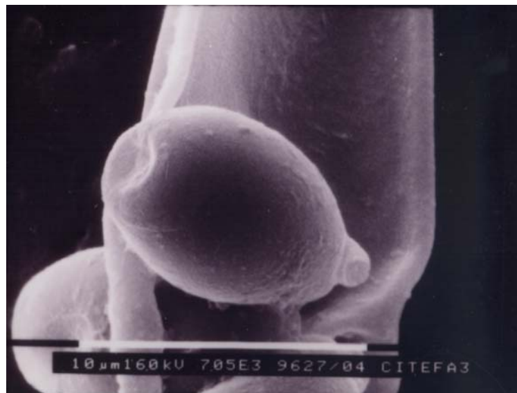
Figura 3. Micrografía electrónica de barrido de basidiosporas de Podaxis pistillaris .