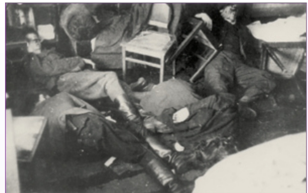
Rytas po balius.