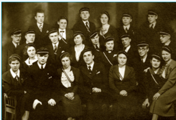
Vytauto Didžiojo universiteto studentų ateitininkų meno draugijos „Šatrija“ nariai. Apie 1937 – 1938 m., Kaunas