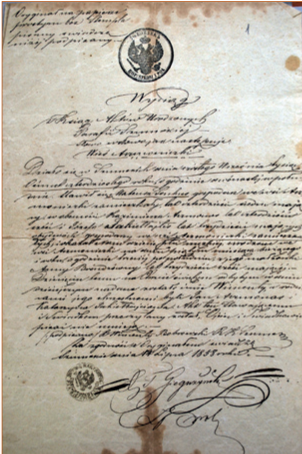
Krikšto liudijimo išrašas