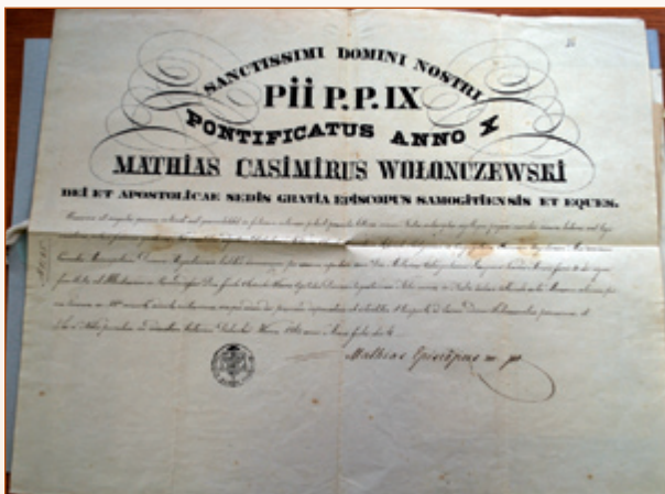
Šventimų, kuriuos suteikė vyskupas Motiejus Valančius, liudijimas