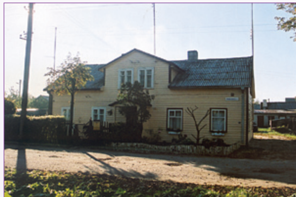
Namas, kuriame vyko Užgavėnių balius.