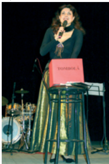
14 decembrie 2006. Toți cei care au făcut daruri, venind la concertul de Sfântul Nicolae, s-au bucurat de darurile unei tombole...

- Câți bani s-au adunat și de ce, din nou, destinația este Casa de copii din Corten, Taraclia?