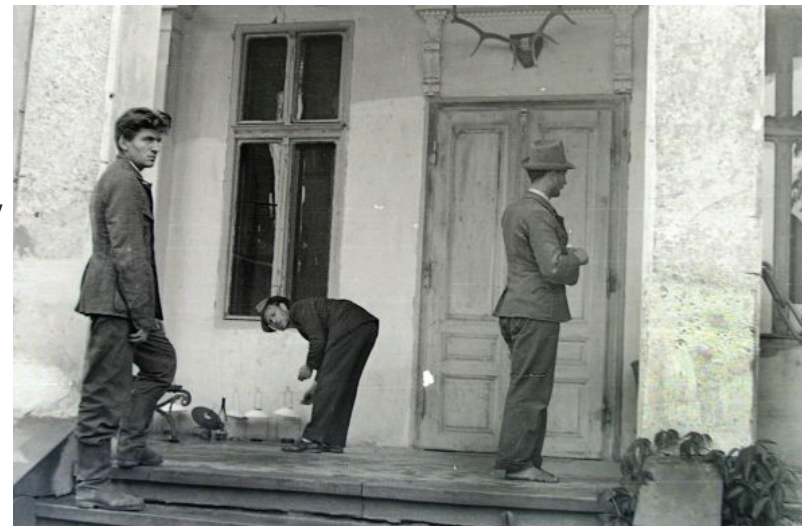
A helyszínen beállítják a szereplőket a feltételezett lövés pillanatában feltételezett helyzetben. Az elmondások szerint ez nem felelt meg a valóságnak, nem beszélve arról, hogy világitás hiányában szinte semmit nem lehetett látni

A négy fő vádolt a helyszínen, még a gyanúsítás előtt