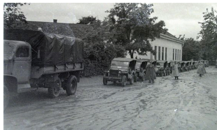
Teherautókkal érkeztek Budapestről, a Radecký-laktanyából, valamint a Rendőrakadémiáról is rendőrök