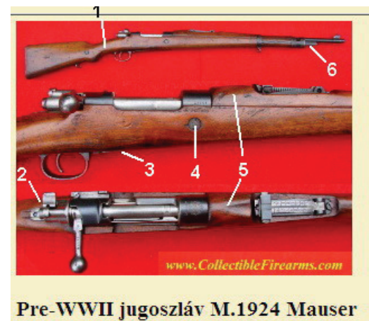
Pre-WWII jugoszláv M.1924 Mauser