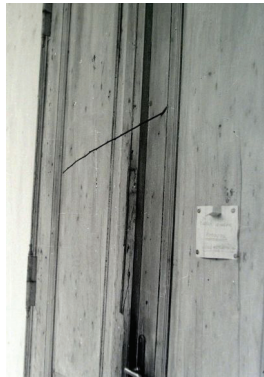
A lőirányt, az ajtóba fúródott lőszer nyomát jelzi a faág