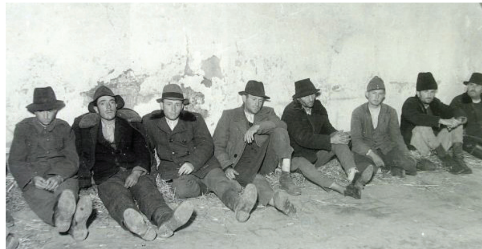
A férfiakat összeterezték, és egyenként hallgatta ki Princz Gyula csapata

Talán ezért zárták körbe hermetikusan a falút, hogy az ott történetekről csak azok a hírek menjenek ki, amelyek alátámasztották a