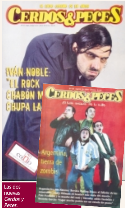
Las dos nuevas Cerdos y Peces . Lejos de los estereotipos

La relación de Enrique Symns y los Redondos fue de amor-odio. A fines de los '70, Symns ocupó el lugar de monologuista oficial dentro del circo itinerante que por esos años alistaba la banda en cada presentación. Mientras la popularidad golpeaba a las puertas de los Redonditos, la relación con Symns se enfriaba cada vez más. El punto de inflexión fue la primera vez que la banda tocó en Obras, lugar siempre fustigado por el Indio Solari. Desde la Cerdos y Peces , Symns rompió lanzas. Y hubo más: en 1992 publicó un