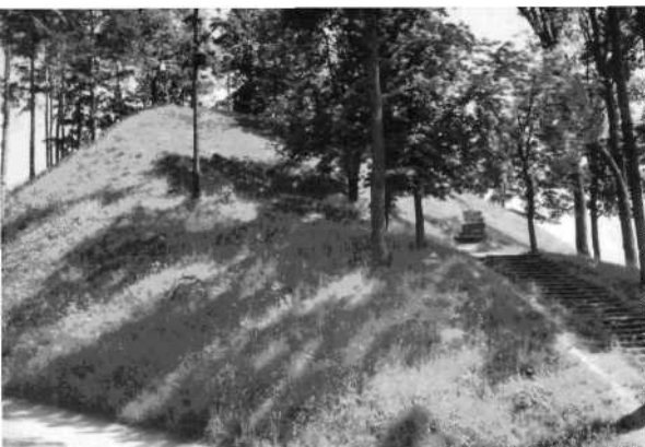
Gedimino kabo kalnas.

Veliunos dvare įsikūręs muziejus. Be piliakalnių dar galima įkopti į bažnyčios bokštą. Centre apžiūrėti Vytauto Didžiojo paminklą, bareljefą Gediminui.