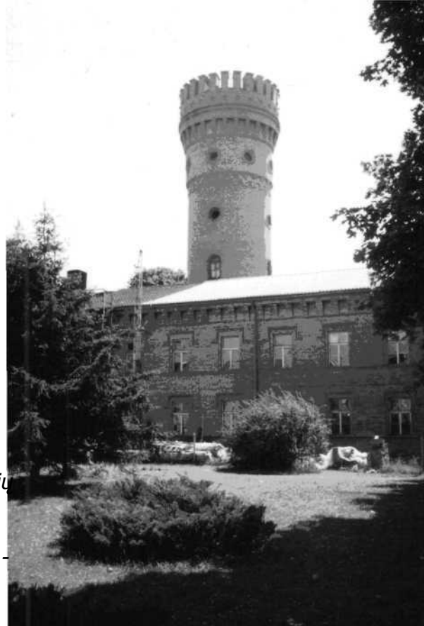
Raudonės pilis.

Dėl tokios besikeičiančios pilies paskirties apie ją pripinta įvairiausių legendų. Neva pilyje vaidenasi kryžiuočių, nukankintų baudžiauninkų, kalinių moterų dvasios. Naktį įsiklausius girdėti raudos ir riksmi. Daugybė legendų sklendo apie Raudonės dvaro parke augančius medžius. Raudonės dvaro parke auga sena pušis, kurios šakos tarpusavyje susivijusios ir nukarusios iki žemės. Žmonės pasakoja, kad ant šios pušies dvarininkai kardavo baudžiauninkus. Panašus padavimas sklendo ir apie parke augančią liepą, kurios šakose dar ir dabar yra įaugusi geležies juosta. Sakoma, kad dvarininkai prie jos rišdavo ir plakdavo baudžiauninkus. Dar parke auga senas ažuolas, po kuriuo, pasakojama, po medžioklės mėgdavęs numigti kunigaikštis Vytautas. Šis ažuolas turi du kamienus. Jie tarsi simbolizuoja giminės tęstinumą. Vienas kamienas - kunigaikščio Gedimino, kitas - jo sūnaus Kęstučio. Anot legendos, po Kęstučio nužudymo šalia šio ažuolo dieną naktį baltais drabužiais pasipuošusi raudojo Kęstučio dukra Balanda. Nuo to laiko ir pilis Raudone vadinama. Deja, ažuolas nudžiūvo, likę tik stuobriai. Netoli ažuolo yra kalnelis,