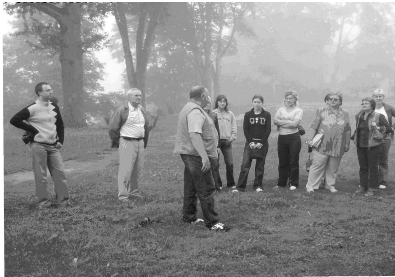
Šio rašinio autorius su ekskursantais Rambyno kalne.

2005 m. Pagėgiuose, buvusios koncentracijos stovyklos teritorijoje, iškilmingai atidengta memorialinė plokštė karo aukų atminimui.