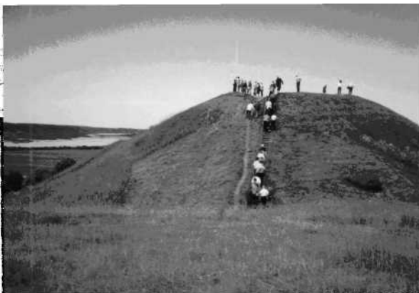
Turistų pamėgtas Seredžiaus piliakalnis.

Šv. Jono Krikštytojo bažnyčia aukštutinėje terasoje pastatyta 1913 m. Ji - mūrinė, neorenesansinė, stačiakampio plano, halinė, dvibokštė, su penkiasiene apside. Vidus 3 navų.