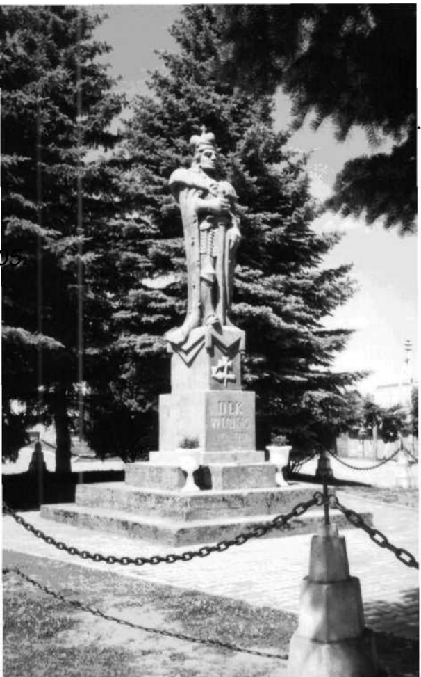
Paminklas Vytautui Didžiajam.