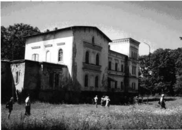
Belvederio dvaro rūmai.

Nuo panemunės į dvarą veda 60 m. aukščio laiptai su 365 pakopomis.