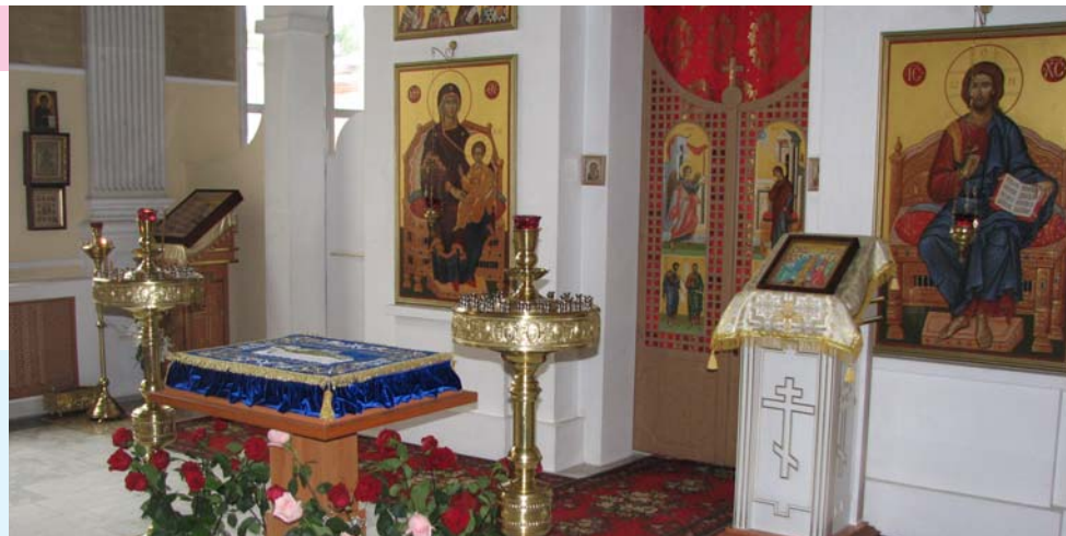
Домовый храм во имя св. мученицы Татианы при МаГТУ.