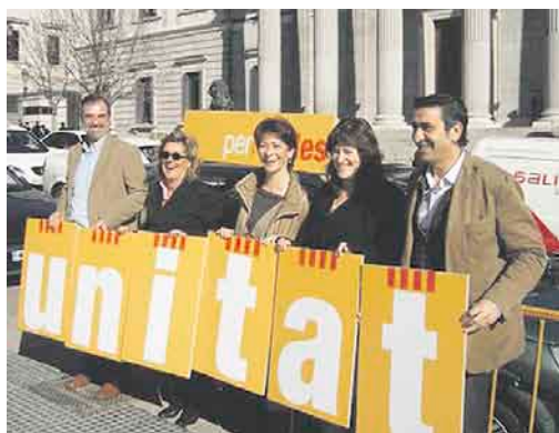
UNITAT PER LES ILLES

L'endemà de les eleccions a les Corts de l'Estat espanyol Biel Barceló, secretari general del PSM, va anunciar que la seva formació es desentenia d'Unitat per les Illes a causa dels mals resultats i del fet que no hagués obtingut representació.