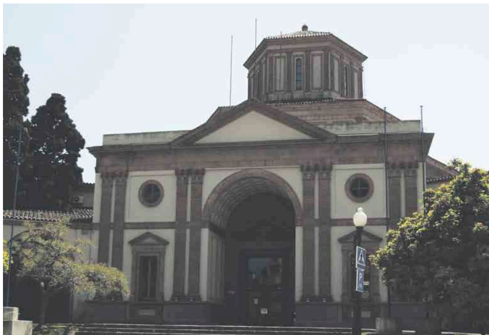
Façana del Museu d'Arqueologia