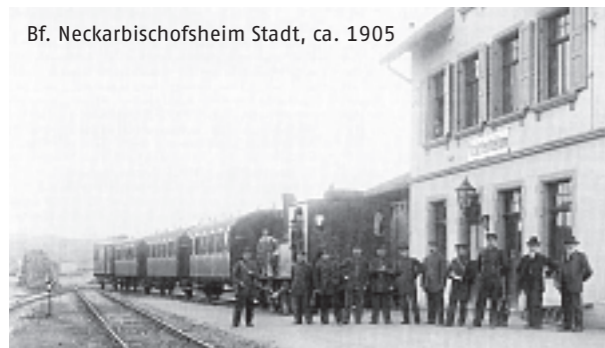
Bf. Neckarbischofsheim Stadt, ca. 1905

diese Region im Kraichgau eine Bereicherung darstellen wird.