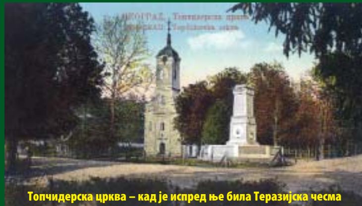
Топчидерска црква – кад је испред ње била Теразијска чесма