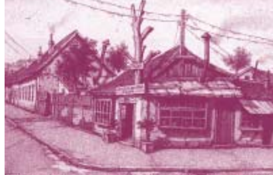
Угао Балканске и Немањине улице

вином морају поред ње и да се настане. Абацијску чаршију планирао је у данашњој Улици краљице Наталије. Свим тадашњим станарима тог дела Савамале понудио је да уместо кућерака у којима су до тада живели подигну пристојније куће и радње и да за то бесплатно посеку свако дрво из шума око Београда. Како то нико није учинио наредио је да се овај крај расели у Палилулу, што је и урађено буквално за један дан. На празном простору у новопросеченој чаршији о државном трошку је подигну-