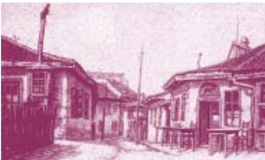
Поп Лукина улица и кафана „Црни коњ“

Урбанизовање Савамале (Сава махале) почиње почетком 19. века, у време кад је то већ било село са стотинак кућерака распрострањених на делу од Варош капије, која је била негде код Поп Лукине улице, преко у то време делимично мочварног терена, који данас омеђавају улице: Карађорђева, Савска, Гаврила Принципа, Сарајевска и Краљице Наталије.