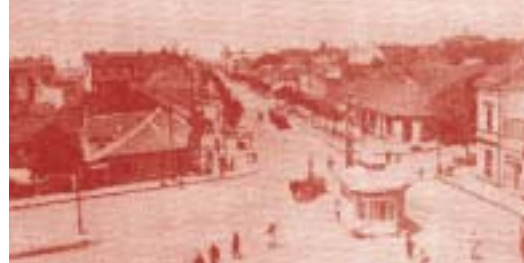
Славија: с леве стране кафана „Три сељака“, с десне стране кафана „Рудничанин“ (снимак с почетка 20. века)

Даљи развој Славије и краја око ње инициран је 1892. године, покретањем прве трамвајске линије са коњском запрегом у тадашњем