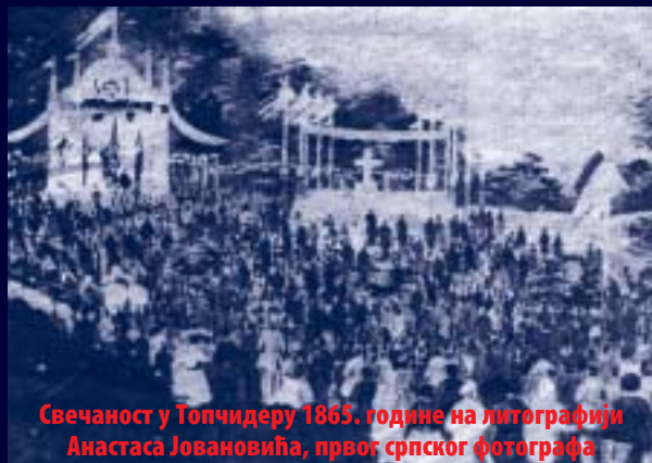
Свечаност у Топчидеру 1865. године на литографији Анастаса Јовановића, првог српског фотографа

Прослава 50-годишњице Другог српског устанка одржана је 23. маја 1865. године у Топчидеру и сматра се првим организованим окупљањем грађана, на које се „сјатио цео Београд“. Све је на овом „митингу“ било добро припремљено: и сценографија и протокол и организација. Први пут грађани су могли да виде трибине, државне заставе на јарболима, паное на којима су осликани историјски призори, као и свечани уметнички програм.