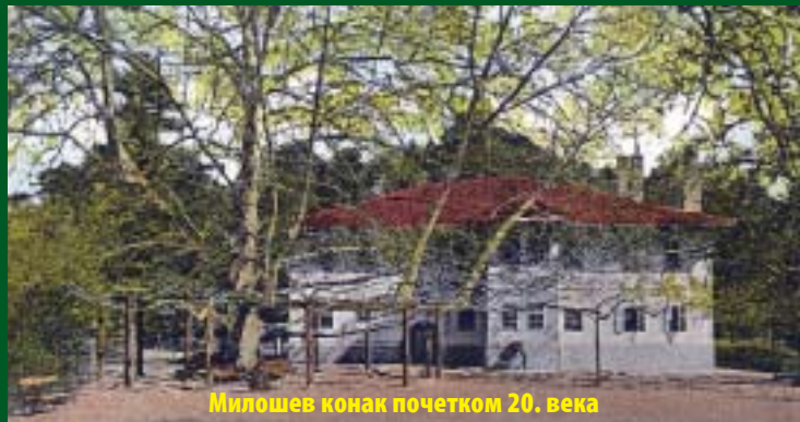
Милошев конак почетком 20. века

Шума је била најгушћа управо испод Топчидерског брда, на безбедној удаљености од Турака и њихових топова, тако да је кнез Милош решио да баш на том месту, у сенци старог платана подигне свој дом – Велики конак, који је био уједно и први двор кнежевине Србије, по нацртима чувеног Хаџи Николе Ђорђевића. Уз конак, за то време велику грађевину на два спрата, са пространим тремовима и „диванханом“, својеврсним застакљеним балконом, одакле се, са дивана, могла посматрати околина, књаз је подигао и Топчидерску цркву (Светог Петра и Павла), која је завршена исте 1834. године, а потом и