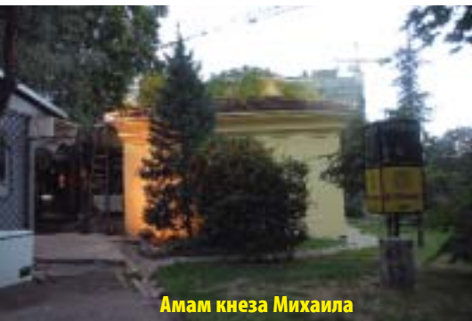
Амам кнеза Михаила

Стара зграда Совјета порушена је 1931. а од тих првих значајних грађевина данас је остао само део Велике касарне (уз комплекс зграда старог Генералштаба), као и Амам кнеза Михаила, у улици Адмирала Гепрата број 14 у ком је данас смештен кафић (?) „Монумент“.