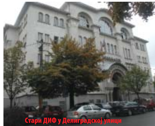
Стари ДИФ у Делиградској улици

да-музеј има немерљив значај у историји југословенског и српског спорта и за њу су везана његова најлепша поглавља.