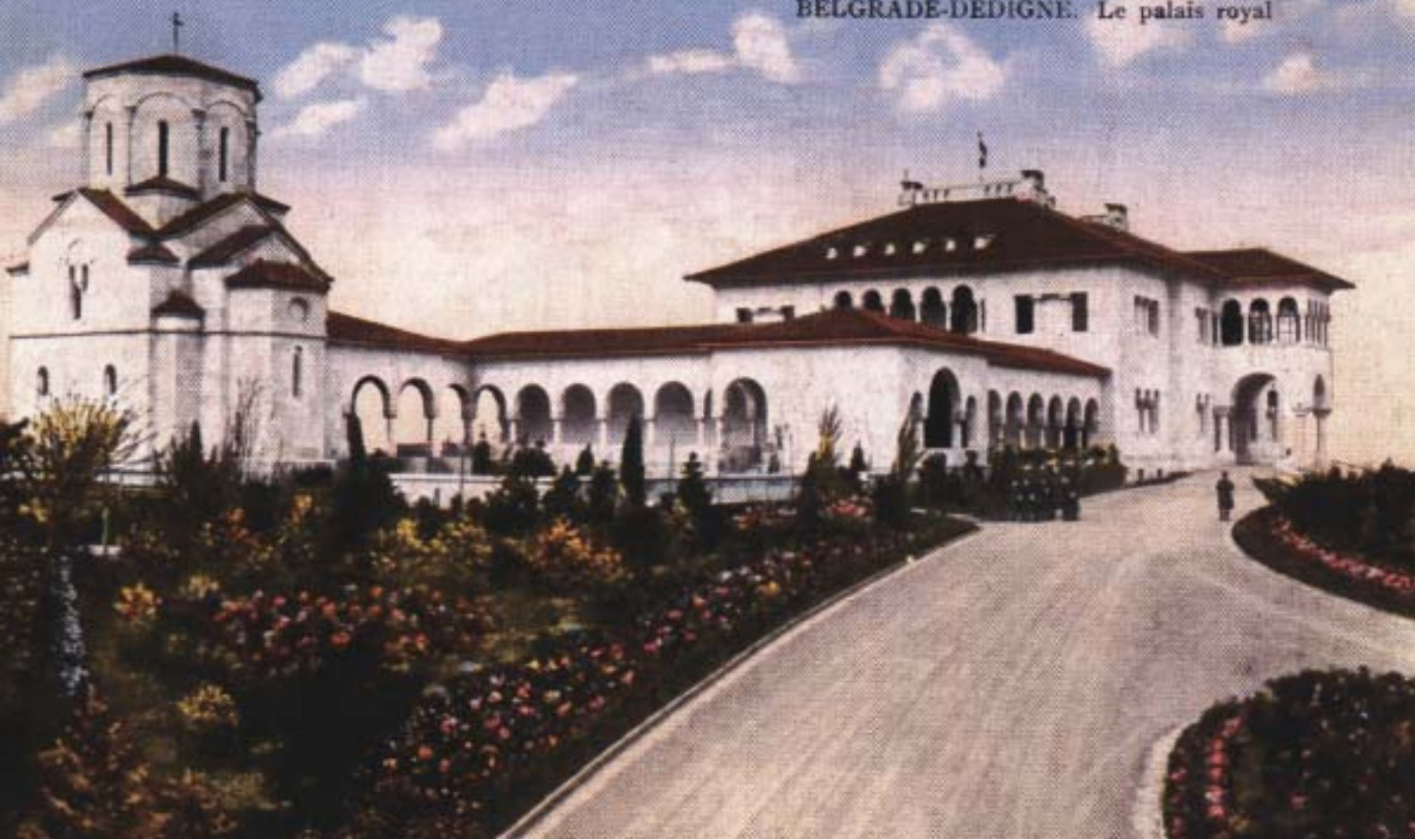
БЕОГРАД. Дворац Н. В. Краља на Дедињу BELGRADE-DEDIGNE. Le palais royal