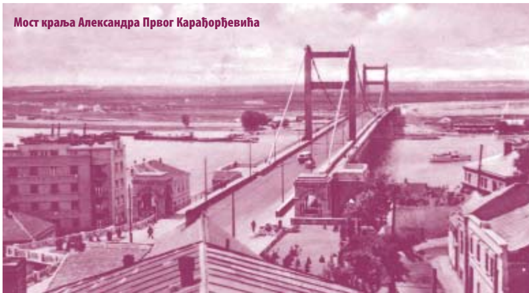
Мост краља Александра Првог Карађорђевића

Мост је свечано отворен 16. децембра 1934. а први трамвај између Београда и Земуна прошао је њиме 5. новембра 1935. године, баш на