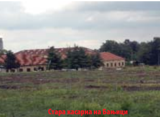
Стара касарна на Бањици

Многи читаоци ове публикације, неупућени подробније у историју и географију Савског венца упитаће се, видевши овај наслов „шта ће Бањица у склопу Савског венца?“, јер прва асоцијација на ово насеље, руку на срце, јесте