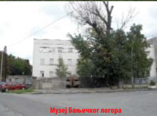
Музеј Бањичког логора

општина Вождовац на којој се простире њен већи део.