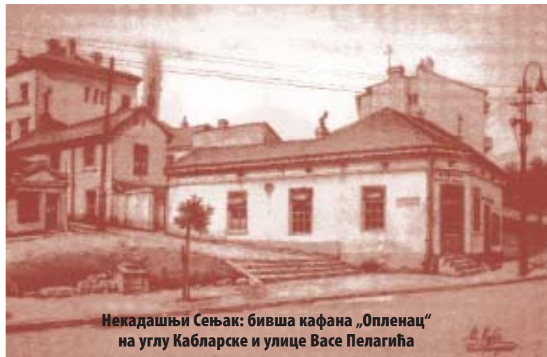
Некадашњи Сењак: бивша кафана „Опленац“ на углу Кабларске и улице Васе Пелагића

Ово елитно београдско насеље све до пред крај 19. века било је готово потпуно ненасељено, с тек понеким летњиковцем. Тада су се ту још увек налазила војна складишта сена, по чему је крај и добио име. Развојем индустрије и дизањем бројних фабрика на оближњем Мостару овај крај, пошто је војска одатле иселила складишта сена, а име остало, почели су да насељавају сиромашни радници који су радили у тим фабрикама или на железници. Но, кад је с почетком Првог светског рата срушена фабрика дувана у којој је највише њих радило многи су се преселили у насеља ближа граду, Прокоп или Јатаган малу. Уместо њих Сењак су почеле да насељавају успешније занатлије, дижући ту веће, али, иако богатије од радничких, још увек прилично скромне куће. Луксузније виле зидане су између два рата у „вароши“, мада све чешће и на Дедињу и Топчидерском брду.