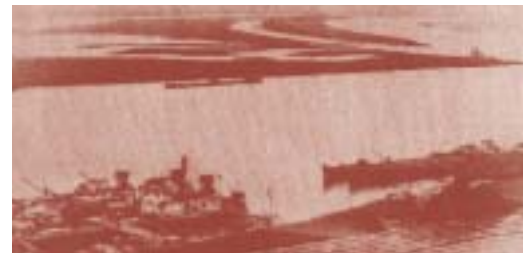
Савско приобаље почетком 20. века

На месту некадашњих ритова настао је данашњи Нови Београд. Давно, међутим, од београдске обале Саве до Земуна вијугао је мост под именом – Дуги, или – Мост преко мочваре. Подигли су га Аустријанци у време окупације Београда 1688-1690. Тврђава је разорена у тек минулом рату и требало је обновити и оспособити као упориште предстојећег аустријског напредовања према Македонији. Нарочито је био важан поправак понтонског моста на Сави од кога се даље настављао Дуги Мост који је постојао и раније, али је у рату оштећен.