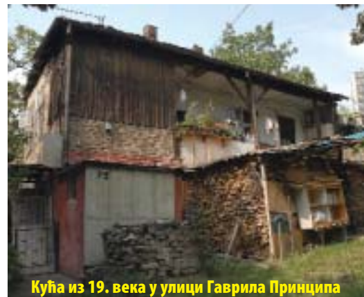
Кућа из 19. века у улици Гаврила Принципа