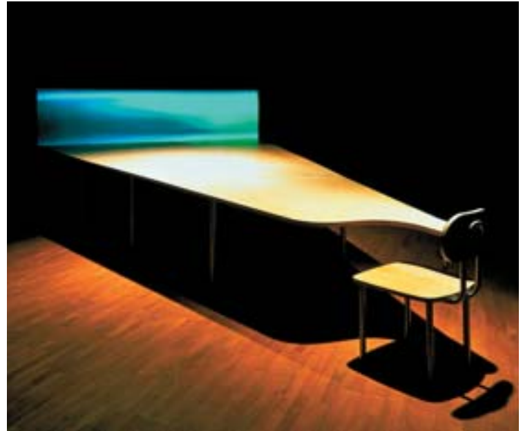
Col·lecció d'art contemporani Fundació "la Caixa" / © Gary Hill, 1993

Gran part de l'obra de Gary Hill se centra en la naturalesa del llenguatge i en la formació cognitiva de les imatges. Les seves videoinstal·lacions desperten en l'espectador la seva consciència de visió mitjançant diferents estratègies que provoquen l'observació i l'avaluació del procés de la seva percepció visual. Learning curve (la corba de l'aprenentatge) és una videoinstal·lació que consisteix en una cadira escolar el pupitre de la qual s'allarga cinc metres fins a arribar a una pantalla corba sobre la qual es projecta repetitivament la imatge del trencant d'una onada. Això crea una associació amb la idea del procés d'aprenentatge, de la reiteració monòtona dels conceptes. Davant d'aquesta continuada reiteració, l'espectador només pot fer allò que suggereix Heidegger: abstraure's i buscar un camí mental no previst.