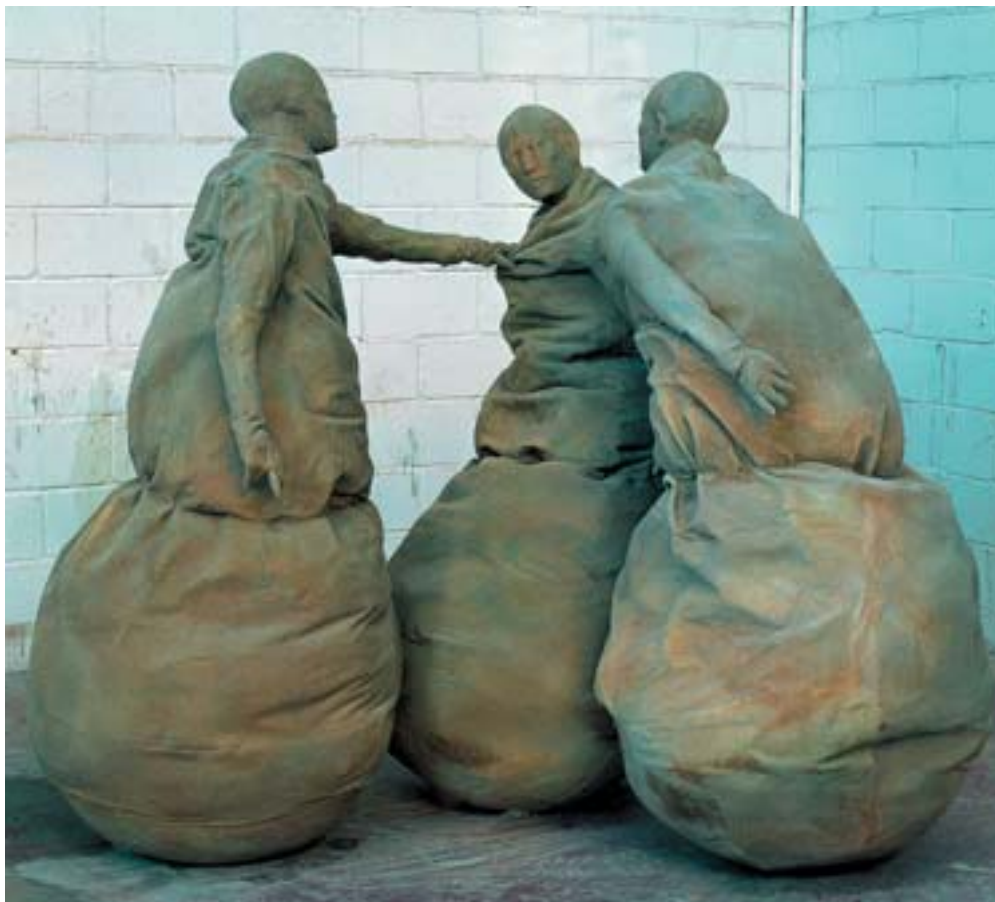
Col·lecció d'art contemporani Fundació "la Caixa"