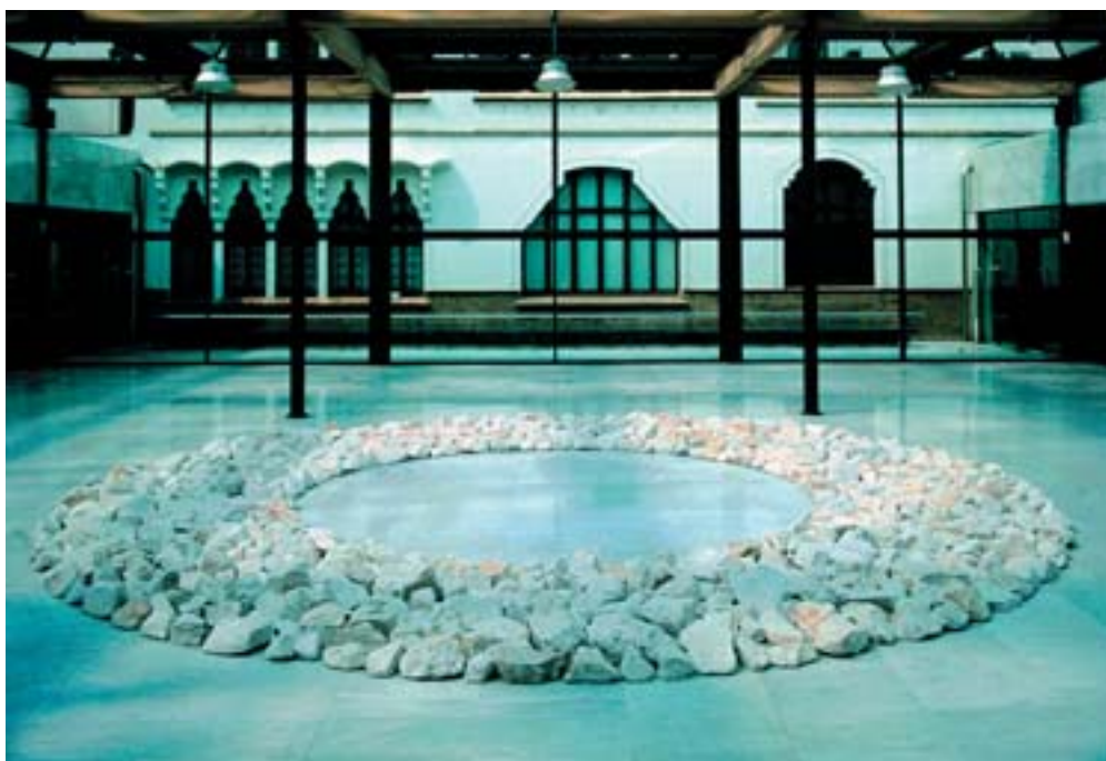
Col·lecció d'art contemporani Fundació "la Caixa"

Considerat l'artista més rellevant del land art europeu, el treball de Richard Long explora dues vies d'actuació molt diferents: en primer lloc, les seves accions en la natura, que fa a manera de llargs recorreguts per paisatges d'arreu del món, i del qual sorgeix un ampli treball fotogràfic i gràfic; en segon lloc, les seves peces escultòriques, realitzades amb tota mena de materials naturals, i que en realitat vénen a ser una transposició a espais interiors de les seves pròpies experiències en la natura. Aquesta escultura la va fer amb marbre de Besalú, i va ser un encàrrec de la Fundació "la Caixa". Va escollir el cercle perquè és una figura atemporal, universal, comprensible i fàcil de realitzar, i també perquè Long és un artista que s'interessa especialment pel poder emocional de les imatges simples.