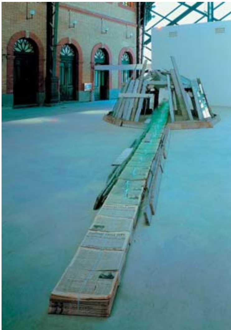
Col·lecció d'art contemporani Fundació "la Caixa"