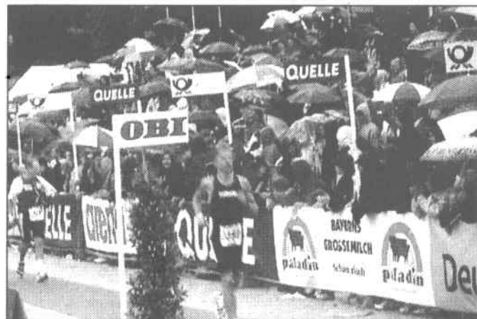
Gänsehaut inclusive: Der Triathlon in Roth ist perfekt organisiert, die Massen sind begeistert – nicht nur beim Zieleinlauf.

Starterfeld. An den Knotenpunkten der Marathonstrecke stehen mehrere Hunderttausende Zuschauer, um die Triathleten immer wieder aufzumuntern. Das Flair im Zielstadion und das Überreichen des wohlverdienten „Finisher T-Shirt“ nach Überschreiten der Ziellinie lässt einen die Strapazen der bewältigten 226 Gesamtkilometer vergessen.