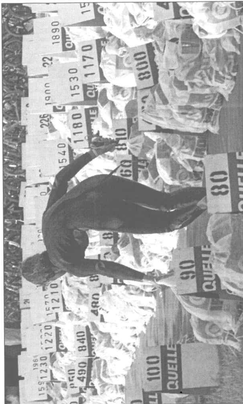
Nur die Übersicht bewahren: Bei 2702 Beuteln mussten die „Ironmänner“ in Roth schon die Orientierung behalten, als sie nach dem Schwimmen ihre Fahrradausrüstung suchten. Selbst in den Wechselzonen ging es um wichtige Sekunden.

Der Ironman in Roth war aber nicht nur ein Kampf gegen die Distanzen und die Uhr, sondern auch einer gegen das Wetter. Kälte, Wind und Regen ließen die Triathleten frieren, auf den mit Wasserfüßen übersäten Straßen gab es zudem etliche Stürze. Trotzdem wurden die Ausdauerstrotzer von den Wo- gen der Begeisterung an den Strecken getragen. "Am Solarer Berg standen die Zuschauer so dicht Spalier wie bei der Tour de France. Mir ist dabei die Kette vom Fahrrad abgesprungen, und ich musste die Zuschauer zur Seite schieben, damit die nachfolgenden Teilnehmer vor- bei konnten", beschreibt Henry