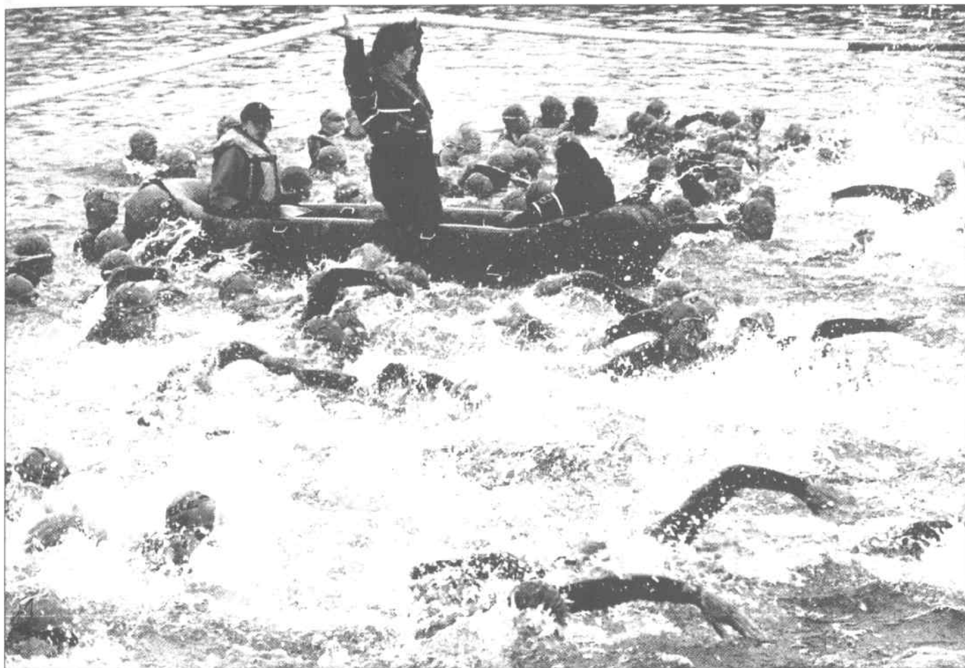
REIN INS WASSER: 2704 Triathleten tauchten im 19,7 Grad kalten Europakanal ab. Den Startschuss gab es gestern um 6.10 Uhr.