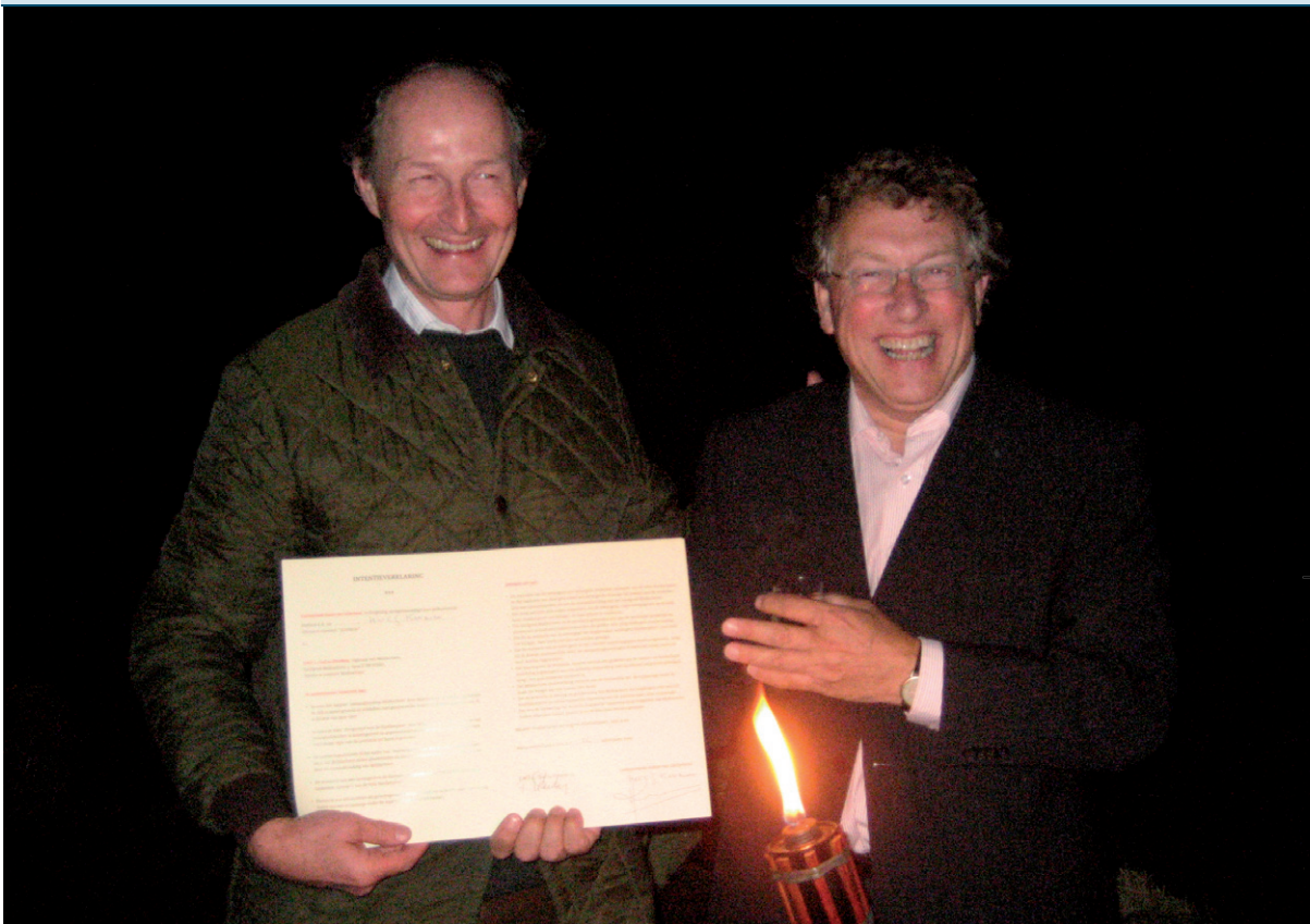
Ondertekening intentie-overeenkomst Middachten.