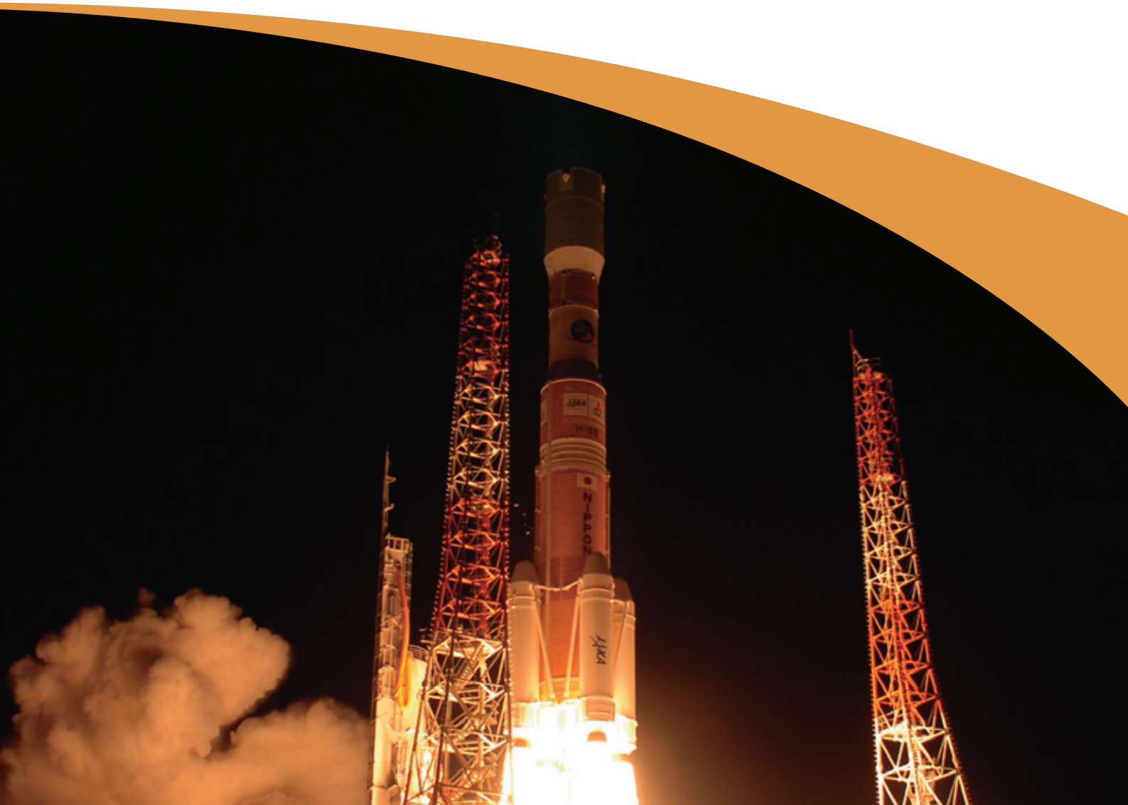
H-IIBロケット試験機の打ち上げ(2009年9月) Launch of H-II B Launch Vehicle Test Flight(Sept. 2009)

日本はこれまで、さまざまな研究と実験を重ねながら、独自の技術でロケットを開発してきました。なかでもH-IIAロケットは、信頼性の高い大型主力ロケットとして、各種の人工衛星を打ち上げるミッションを支えてきました。