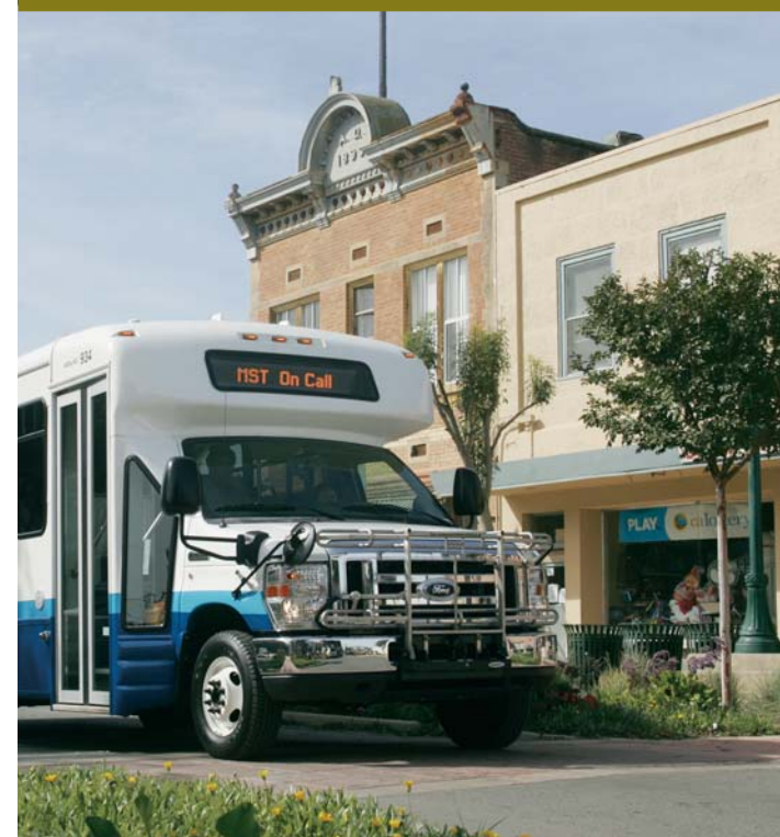
July 5, 2010

Big Sur Carmel Carmel Valley Castroville Chualar Del Rey Oaks Elkhorn Gilroy Gonzales Greenfield King City Marina Monterey Morgan Hill Moss Landing Pacific Grove Pajaro Pebble Beach Prunedale Salinas Sand City San Jose Seaside Soledad Watsonville