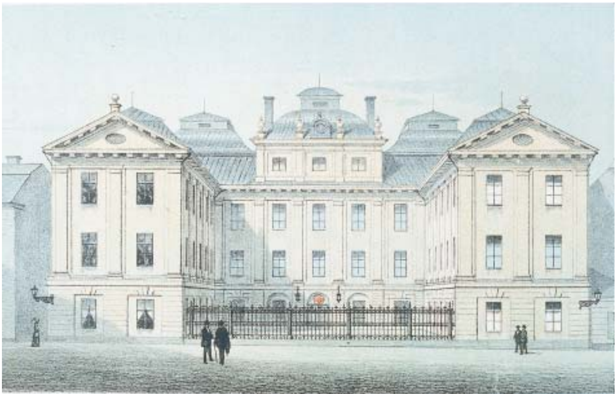
Svenska Frimurare Ordens stamhus, Bååtska palatset, där ordensledningen också har sitt säte. Blasieholmen, Stockholm.

Ordens många vackra logelokaler innehåller intressanta kultur- och konsthistoriska samlingar. Visningar av stamhuset och andra frimurarlokaler arrangeras för besökande grupper.