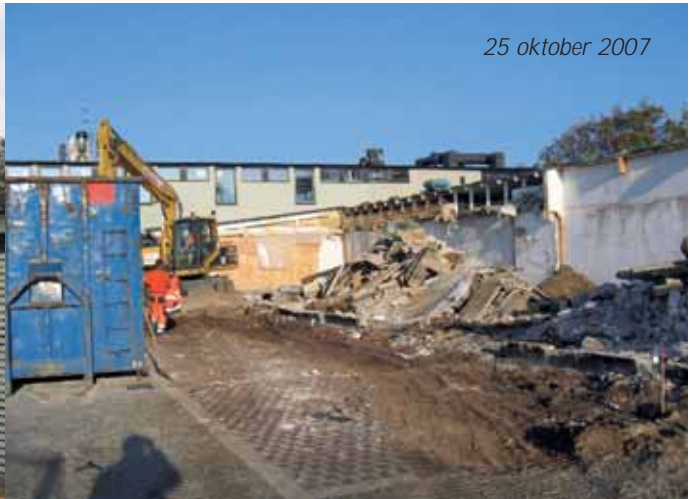
25 oktober 2007