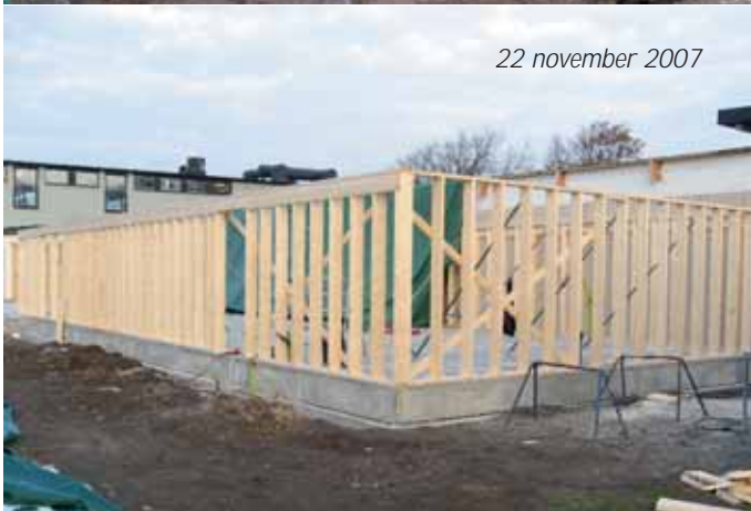
22 november 2007