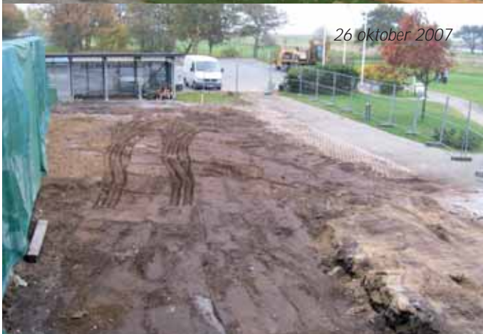
26 oktober 2007