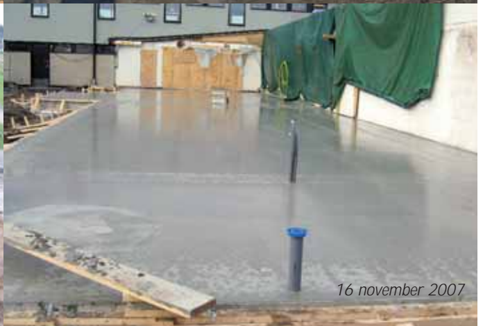
16 november 2007