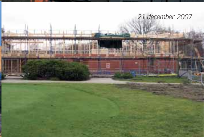
21 december 2007