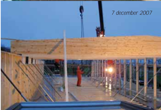
7 december 2007