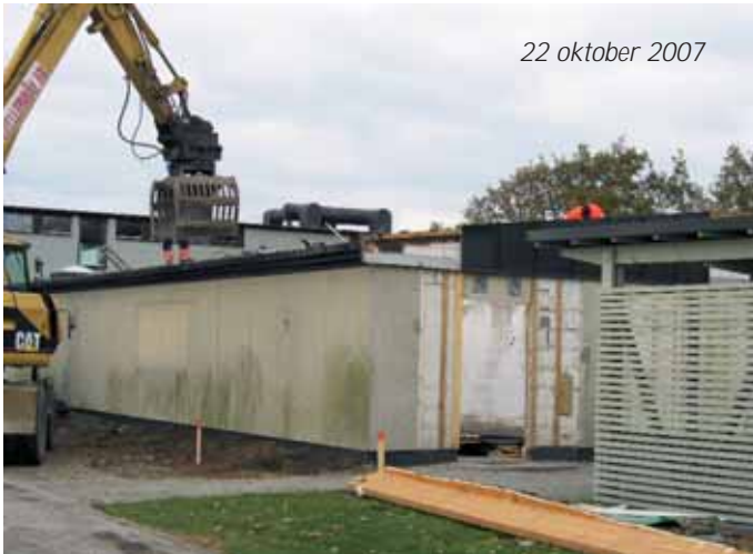
22 oktober 2007