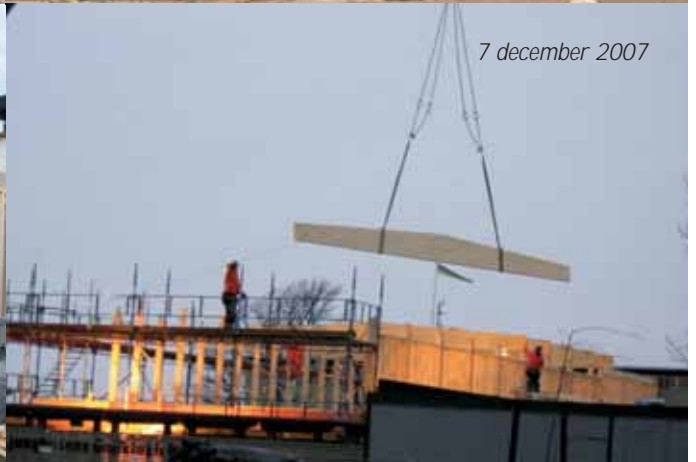
7 december 2007