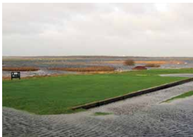
Översvämnning tee 16.