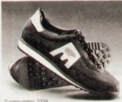
Tuotenumero: 2338 UUTUUS NAVY STAR

Ilmatynny™ Karhujen valikoimista löytyy jalkine jokaiseen käyttötarkoitukseen, erilaisille alustoille, maastojuoksuun, vapaa-aikaan. Muista että vain Karhu-harjoitus- ja valmennusjalkineissa on Ilmatynny™.