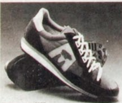
Tuotenumero: 2377 KARHU SYNCHRON