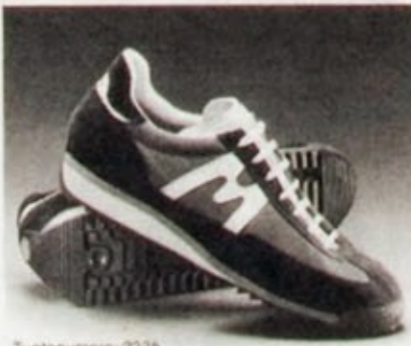
Tuotenumero: 2335 KARHU CHAMPION