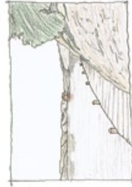
MANÅSINET PÅ KIDDÖN