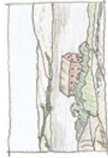
UTSİKT MOT HAMBURÅÖ