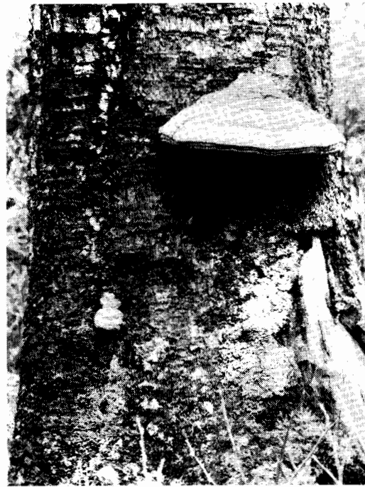
Fnösktickan, — Fomes fomentarius , — på död björk. En liten bryter fram nere till vänster på stammen.