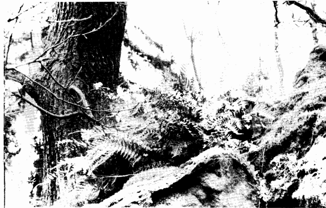
Stensöta på bergsbrant bredvid en av de talrika ekarna.