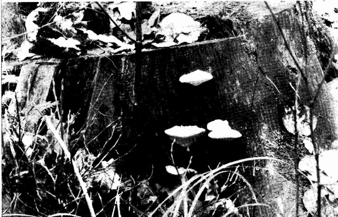
Tyromyces stipticus — bitterticka — på granstubbe.