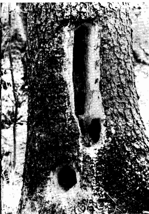
Typiska ätspår av spillkråka som hackat djupt genom frisk ved in till granens centrum för att komma åt hästmyror — Camponotus herculeanus .