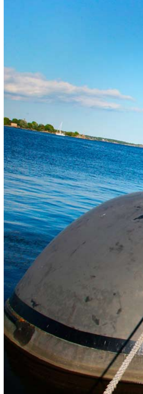
Ute på fartygen upplevs att frågor ibland hamnar

ärende som förs uppåt i organisationen tar vägen.