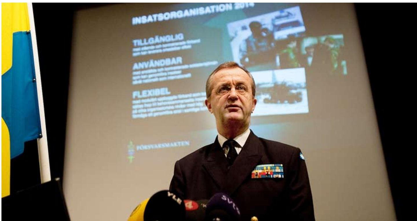
Obalansen mellan givna uppgifter och resurser består, menar officersförbundet i sitt remissvar kring försvarets inriktning till 2014. På bilden syns ÖB Håkan Syrén 30 januari då han presenterar underlaget som getts till regeringen.