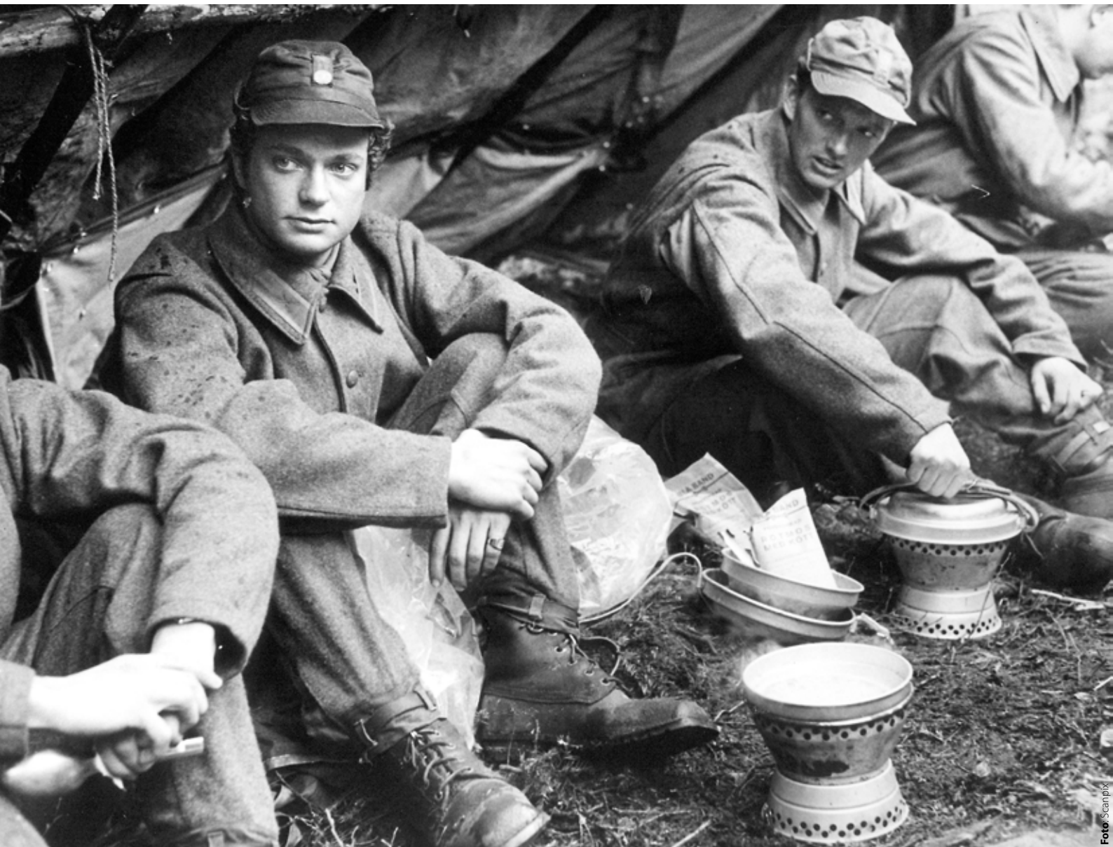
Kronprins Carl Gustaf gör sin militärtjänst.