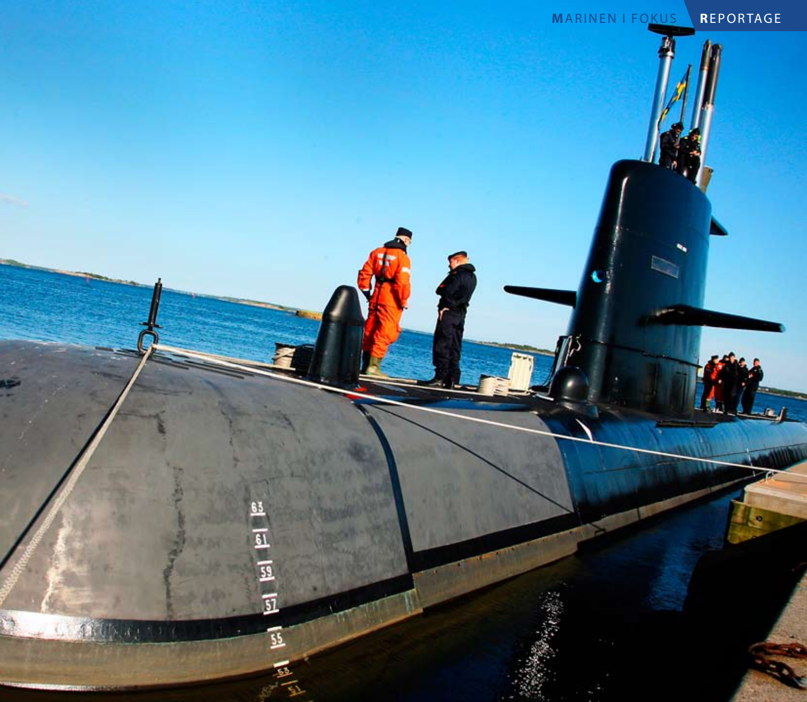
mellan stolarna högre upp i hierarkin. På bild syns ubåten HMS Halland kasta loss från Karlskrona örlogshamn.