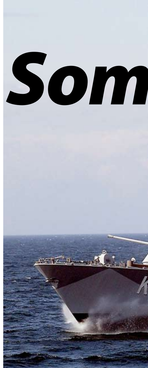
Korvetten HMS Malmö rustas inför en eventuell