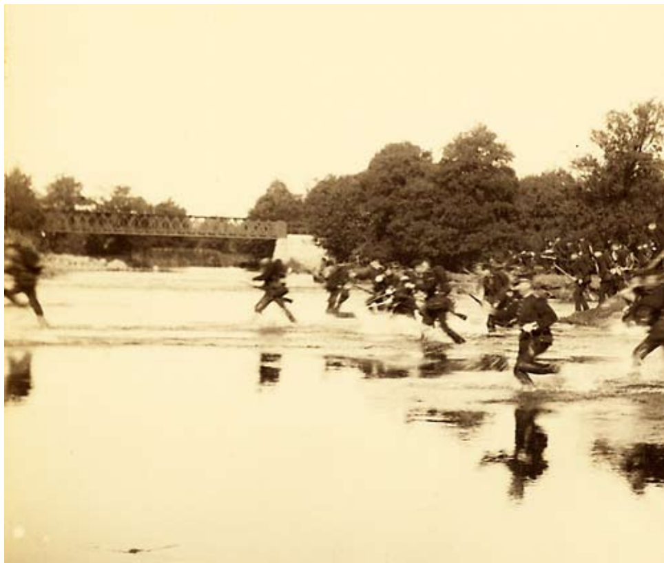
I 11 vadar över Rönneån vid Ljungbyhed. 1890-talet.

De satsningar som gjordes i vårt land på försvaret kring förra sekelskiftet är imponerande. Detta gällde både den kvantitativa