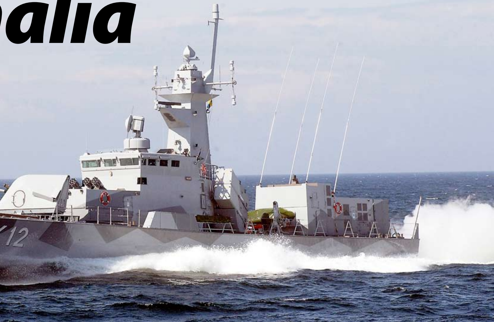
svensk insats i vattnen utanför Somalia.