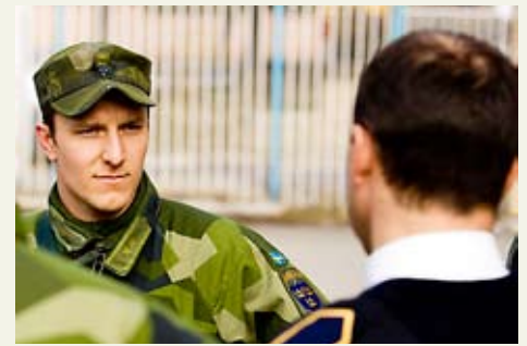
Svensk officer samtalar med kosovansk polis.

Antalet individer inom respektive grad har minskat, eller varit konstant sedan första september 2008. Det visar försvarsmaktens personalstatistik för fjärde kvartalet 2008. (Enligt HKV-skivelse 16 310:51770, daterad 2009-02-02, samt motsvarande statistik för tredje kvartalet 2008).