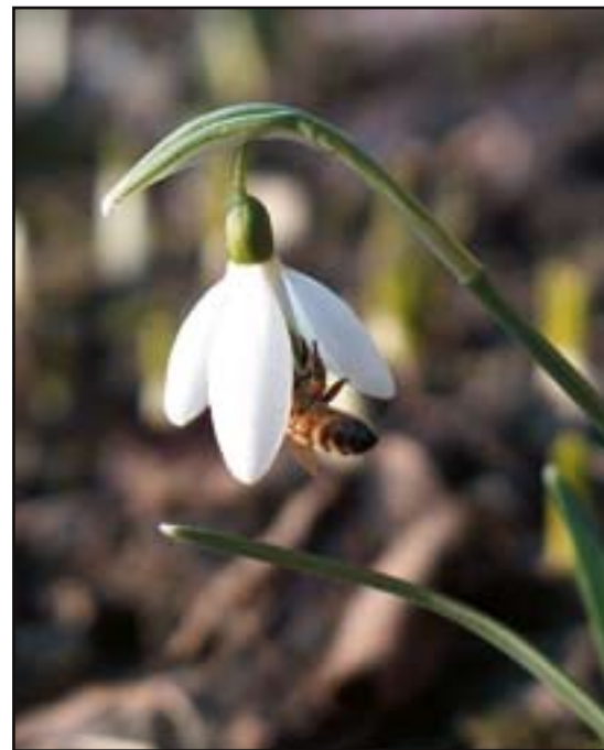
Stora träd som ger nektar är värdefullt. På våren lönnen.. Snödroppen är bland de första blommorna på våren. Bina älskar dem.