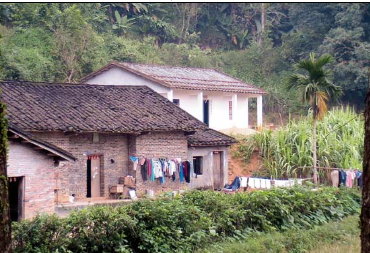
Figur 7. Byn Shang Sui låg vackert men otillgängligt. På torklinan hänger förutom kläder, gummi som pressats till plattor för försäljning. Vid sidan om biodling var gummiträden byns viktigaste inkomstkälla.

ner i en tank. Där sker en jäsprocess med gasbildning som i en rörledning leds in i köket där det finns en ventil vid spisen. Gasen kan antändas och användas som vi använder ett gasolkök. Det här energi-