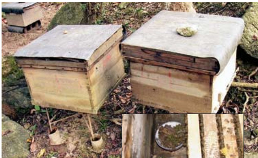
Figur 4. Myror är ett stort problem för biodlare i än högre grad i tropikerna än i Sverige. Bisamhällen måste skyddas mot myror, där det vanligaste sättet med A. cerana samhällen i Kina är att ha en benställning med benen i koppar med vätska.

I byn Ling Tian i östra delen av Qiong Zhong, dit det fanns farbar väg med vanlig bil, fanns 13 familjer som odlade bin med A. cerana (figur 2). Befolkningen i byn tillhör Li-folket, en etnisk minoritet i Kina. Trots att man i byn varit uppe i 150 samhällen tidigare i år var man nu vid regnperiodens slut nere i 80 då man förlorat resten. I den här delen av Kina har