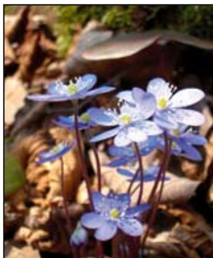
Blåsippor t v (Foto: Archbenzo/Wikipedia). Hästhov (Foto: Archbenzo/Wikipedia). Sälg med bi (Foto: HE Lindskog Krypfoto).

Eftersom jag ger samtliga bisamhällen foder samtidigt i bigården har jag aldrig märkt något röveri.