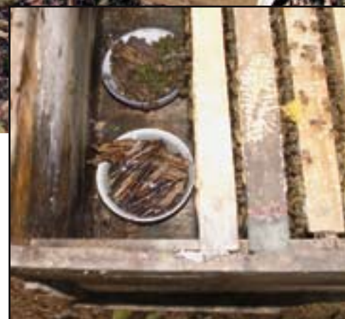
Figur 3. Genom att fodra samhällen under dragfattig tid kan man hindra dem från att flyktsvärma. Fodringen sker invändigt med mycket litet fluster för att förhindra röveri.

man en regnperiod september-november, en blomningsperiod som också är skördetid december-april och därefter en torrperiod när samhällena vissa perioder kan vara helt utan yngel tills det börjar regna igen i september.