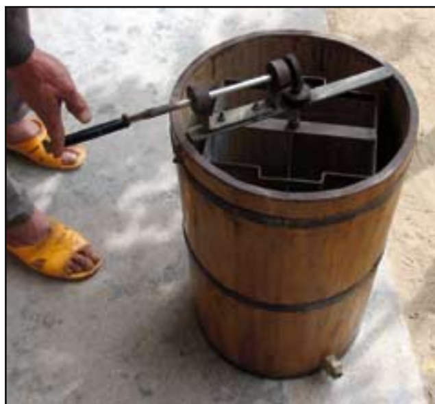
Figur 5. All slungning i byn Ling Tian genomfördes med en enkel handdriven 2-ramars slunga.

När bina börjar samla överskott av nektar i slutet av november slutar man att fodra och väntar tills det finns ramar med täckt honung i. Då slungar man sådana ramar oavsett om det finns yngel i dem eller inte. Slungningen sker försiktigt i en liten tvåramars slunga (figur 5) och yngelramarna återförs sedan till samhällena. På detta vis