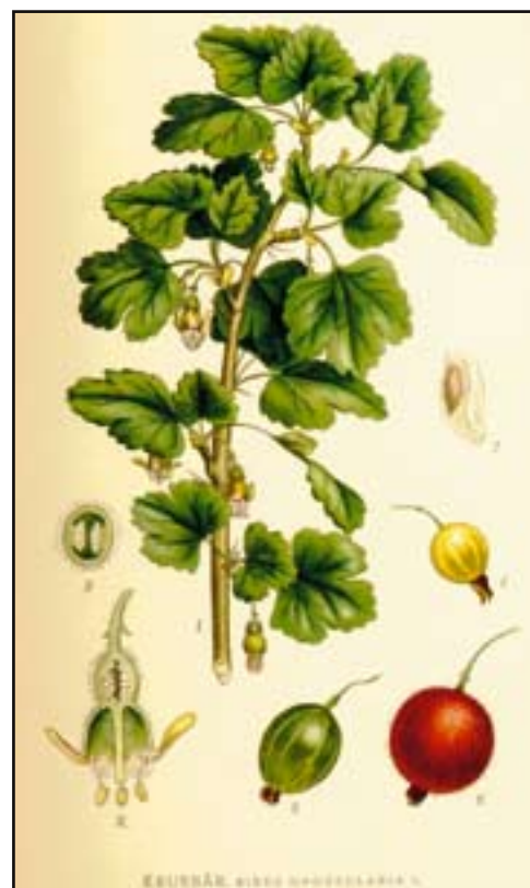
Krusbär i trädgården tycker bina om. Den ger mycket nektar. (Ill.: Nordens flora 1928/Wikipedia.)

Jag fick ett mejl att Mosesdagen är i december månad. Jag har missat att någon flyttat denna heliga dag för oss biodlare från den 4 september till 20 december och då är det ju i senaste laget att slunga. Jätte-