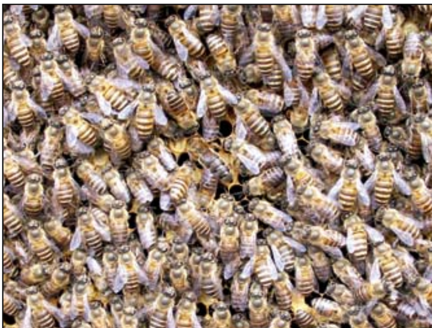
Figur 2. Apis cerana liknar våra europeiska bin, men är mindre och bildar inte lika stora samhällen. Drottningen (mitt i bilden) är alltid mörkfärgad.

Genom ett projekt för att bevara den genetiska variationen hos A. cerana , som