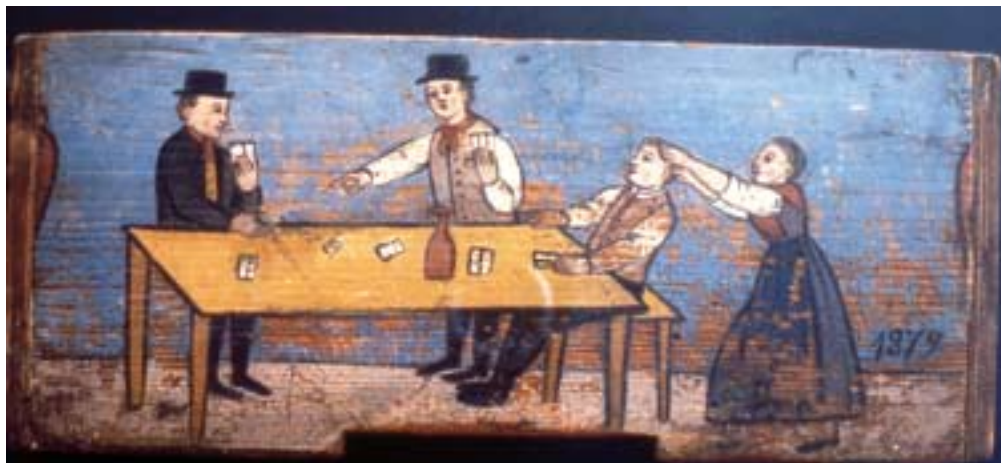
En kvinna hämtar sin man från ett café.

Snart nog började det uppträda bilder också på frontbrädorna, enkla geometris-