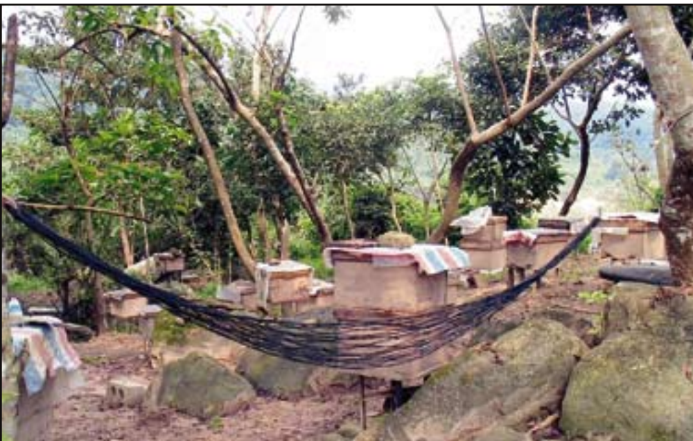
Figur 8. Bergsidorna kring Shang Sui var fulla av bisamhällen. Antagligen för fulla. I förgrunden ett redskap när biodlandet blev för arbetsamt.