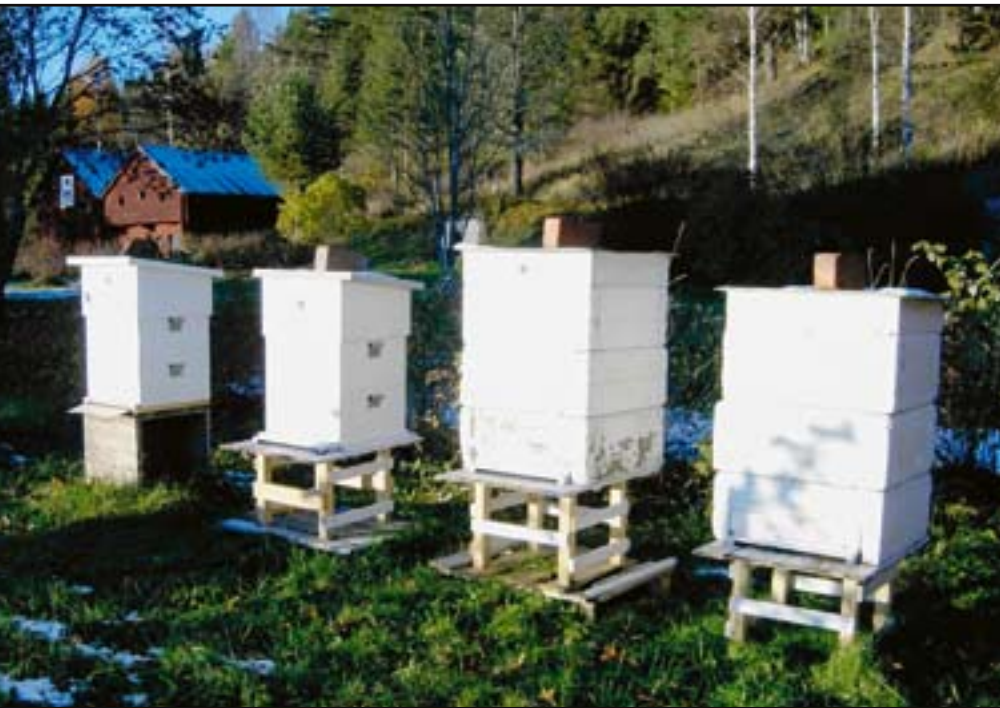
Min första bigård hemma i Resele.

lyfte upp ramarna som om han aldrig gjort annat. Jag tittade och försökte minnas hur det såg ut i boken med drottningceller, täckta honungsramar, för att inte tala om drottningar! Jag tyckte mig se en täckt drottningcell och vi plockade ur en del ramor med honung i. Det var ett otroligt surr därinne, det hade åskat på dagen och nu var det kväll. Svetten rann.