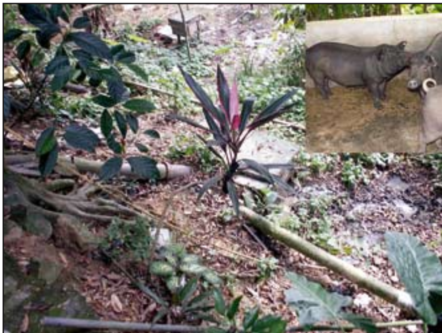
Figur 6. I Liang Tian fanns det lokalt producerad biogas som användes för matlagning. Det tunna röret på bilden leder svinträck ner i en behållare där det jäser. Gasen leds i det grova röret direkt in till kökets gasspis. Infällt, gasproducenterna.

Några sjukdomar man anser att man måste behandla har man inte sett, även om man har både varroakvalster, tropilapelskvalster och även undantagsvis sett döda bilarver.