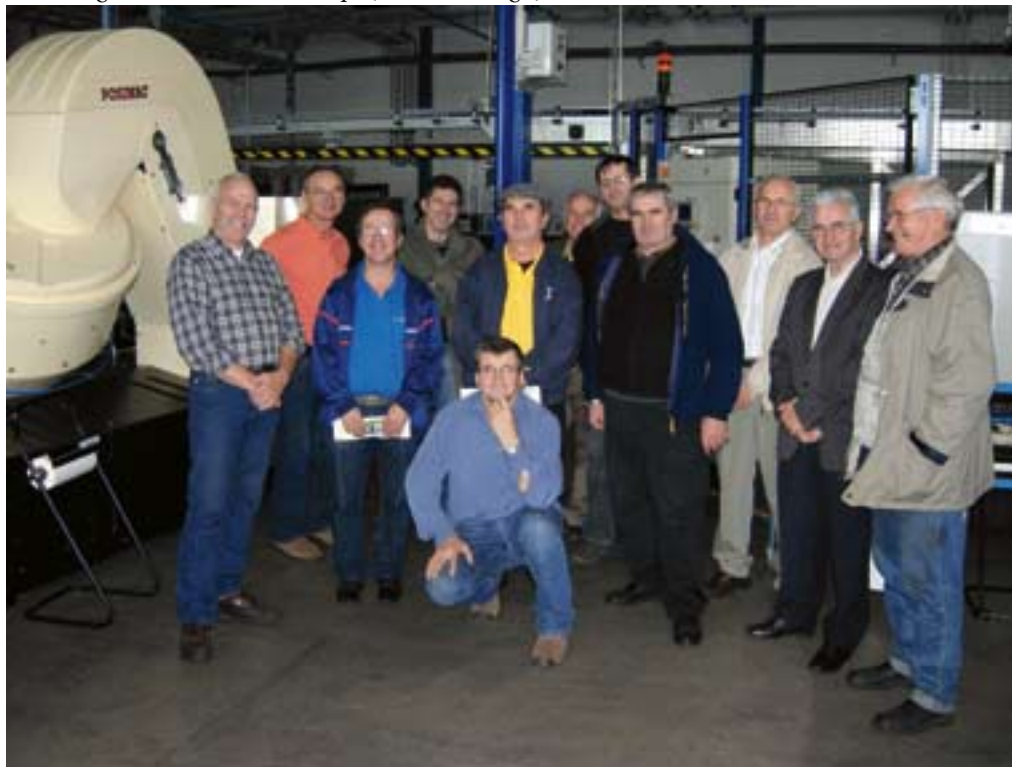
Kursdeltagare i vid mötet i Mantorp.