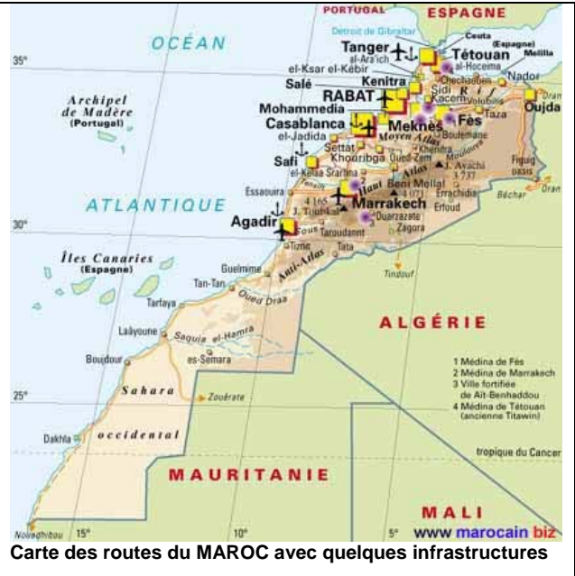
Carte des routes du MAROC avec quelques infrastructures