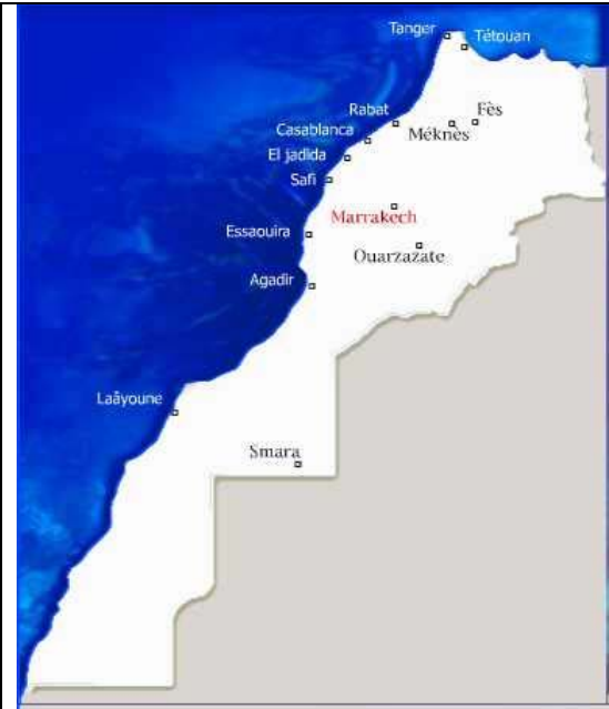
Carte du MAROC avec les principales villes