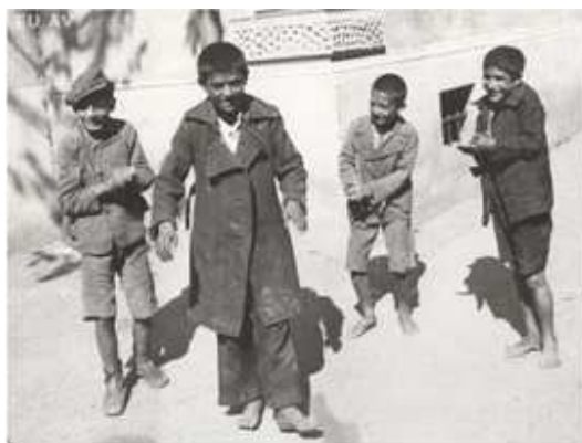
Žák košické školy, Slovensko, 1934

Ti z nich, kteří se nařízení nepodřídili, byli umisťováni do kárných pracovních táborů. Podle evidenčních soupisů, které násilné usazování provázely, se na území protektorátu nacházelo zhruba 7000 Romů. Téměř totožný počet potvrdil i následný soupis ze srpna 1942 během něj byli Romové okamžitě děleni do dvou skupin : v první se ocitli ti, které četníci definovali jako osoby bez zaměstnání nebo osoby, na které měla být uvalena preventivní policejní vazba. Ostatní Romové pak byli pouze varováni, že zanechají-li zaměstnání či projeví-li nechuť k práci, bude s nimi naloženo stejně.