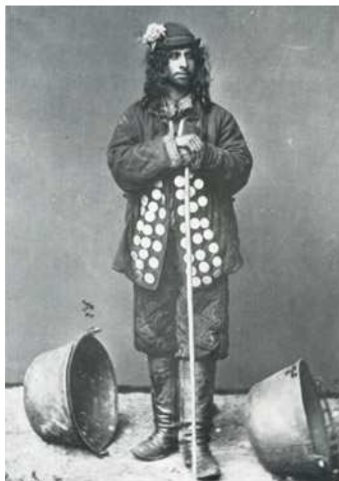
Kotlář, Čechy a Morava, 1865

Asi nejtypičtější romská řemesla souvisejí se zpracováním kovu. Kovářství bylo typické pro kočovníky, přesto bylo jiné než to, kterému se věnovali Romové, kteří se začali usazovat. Usazující se Romové samozřejmě přijímali nástroje od majority, takže kovářství nebylo tak typické, jako u kočovných, kde měli svůj typický kovářský měch, kovářskou kovářinu s bodcem na zabodnutí přímo do země, kovali buď v sedě, v podřepu nebo v sedě na turka. To si patrně donesli ještě z Indie, protože v Indii dodnes některé dómské kasty tímto způsobem kovájí. Dále to byla hlavně výroba měděných nádob, čili kotlářství. To se prakticky už neudrželo ve střední Evropě, ale na Balkáně se takto Romové živí dodnes. Dnes už se také neví, že Romové vyráběli zvonce, ne jen ty vyklepávané za studena, pro dobytek, ale také zvonce lité. Nebyly tak velké jako pro kostely, ale menší zvonečky, přičemž technologie je stejná. Dále to byla i výroba nožů. Přesto v Bulharsku stále existují skupiny, které se dříve věnovaly cínování kotlů, v současné době se věnují výrobě různých plechových nádob, velkých konví na mléko a vodu.