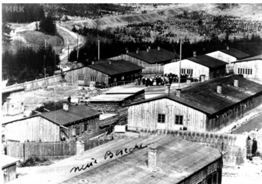
Tábor Hodonín u Kunštátu, 1942-1944

Oba tábory byly přeplněné a panovaly v nich nedobré stravovací a hygienické podmínky. To vedlo až k vypuknutí tyfové epidemie. Nad oběma tábory byla vyhlášena přísná karanténa a od 17. února 1943 byly zcela izolovány od okolního světa. Stráže měly nařízeno v případě pokusu o útěk bez výstrahy střílet. Tato opatření byla vyvolána útekem vězňů z letského tábora. V hodonínském táboře byla ostrahou skutečně při jednom z útěku zbraň použita a prchající vězeň byl postřelen.