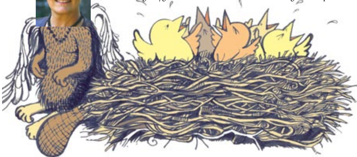
ILLUSTRATION: CHRISTOPHER FERNQVIST

Hon skriver också att vi "måste ha mod att pröva våra vingar". Så om ni ser några flygande bävvar i valrörelsen är de förmodligen centerpartister.