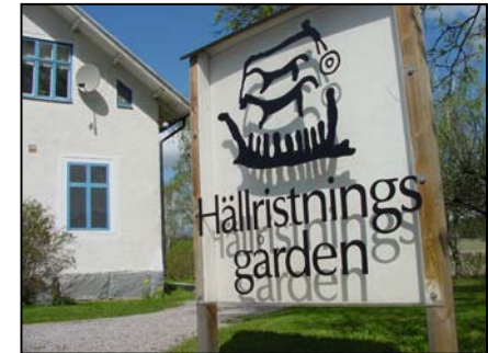
Bild 2. Boglösa hällristningsgård.

Värdarna svarar på frågor och de sköter om utställningen som beskriver Enköpings hällristningar med hjälp av texter, fotografier och modeller.