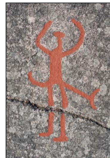
Bild 4. Adorant. Brandskogsskeppshällen.

En bit upp i skogen ovanför ristningen finns det en bronsåldersgrav - en röseliknande stensättning. Delar av graven undersöktes 1926 då brända människoben hittades. Tyvärr gjordes inga andra fynd. Det är lockande att tänka sig att det är Brandskogsskeppets ägare som ligger begravd här. Kanske var han en mäktig hövding och kanske är det han som är adoranten på bilden?