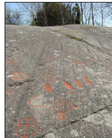
Bild 9. Stora Rickebyhällen.

På bild 9 ser du hur alla fotsulor tycks vara på väg åt ett och samma håll, nerför berget - som om någon har kommit och vänt tillbaka.