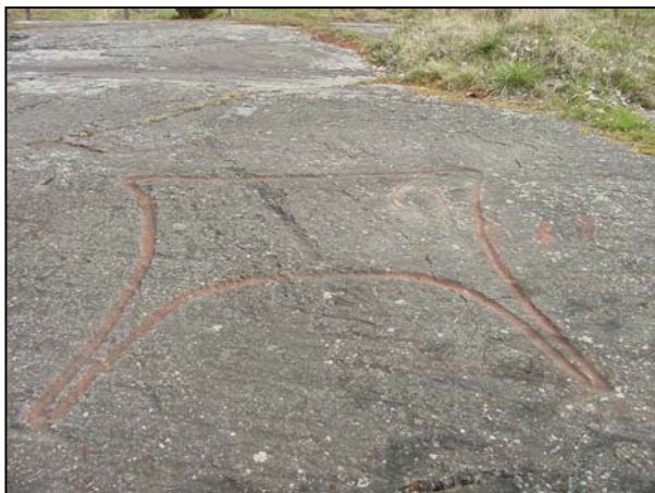
Bild 8. Mantelfigur på stora Rickebyhällen.

På bild 8 ser du hur djupt huggen mantelfiguren är. Förmodligen har den huggits och slipats om och om igen vid flera olika tillfällen.