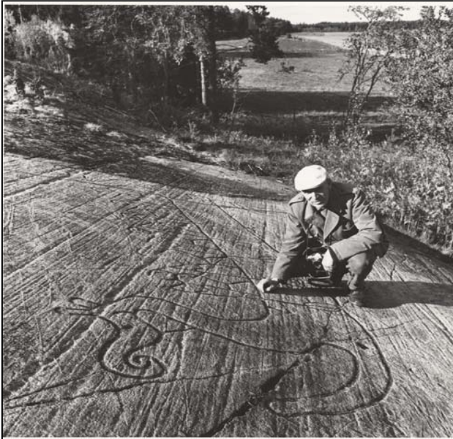
Bild 1. Brandskogsskeppet.