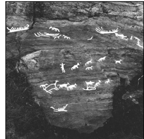
Bild 5. Boskap på Hemstahällen.

Omkring 200 meter norr om Hemstaristningen finns det också ett bronsåldersgravfält och ett boplatsområde med skärvtenshögar – skräphögar från bronsåldern.