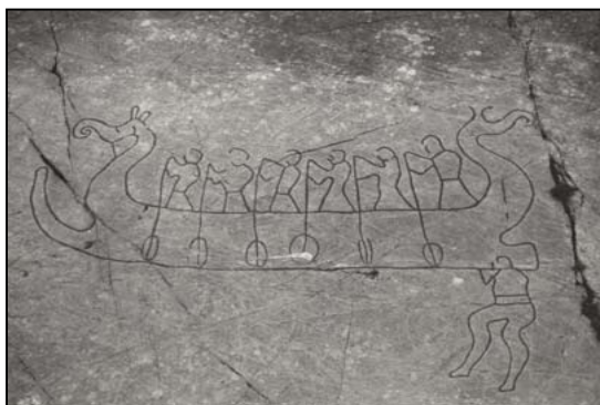
Bild 3. Brandskogsskeppet.

Skeppet bärs av en meterlång människofigur. Kölen vilar på hans axel, och han knälar under sin tunga börda. Vem hjälper till att lyfta i den andra änden - kanske en osynlig gud?