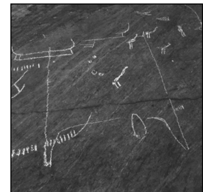
Bild 6. Mantel och tranor på Hemstahällen.