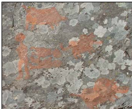
Bild 7. Bröllopsceremonin på Hemstahällen.