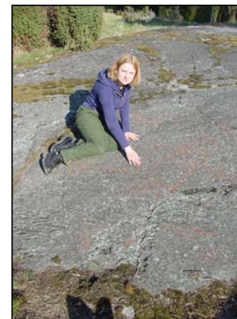
Bild 11. Man med sköld i Rickeby (fornlämning 298).

Under bronsåldern börjar ett mer krigiskt samhälle växa fram och vapenkonflikter verkar inte ha varit något främmande för Enköpingsområdets bronsåldersfolk.