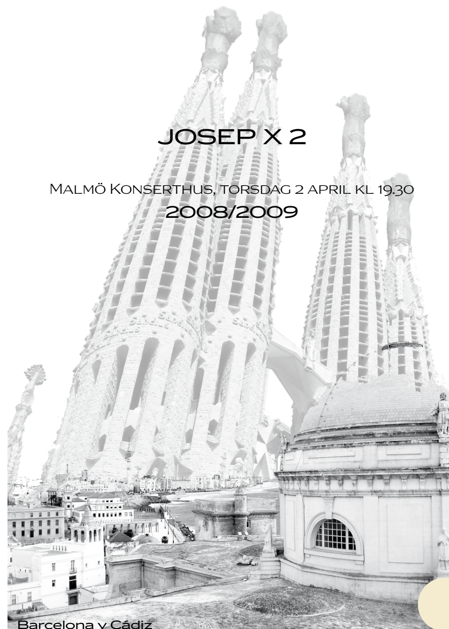
Barcelona y Cádiz