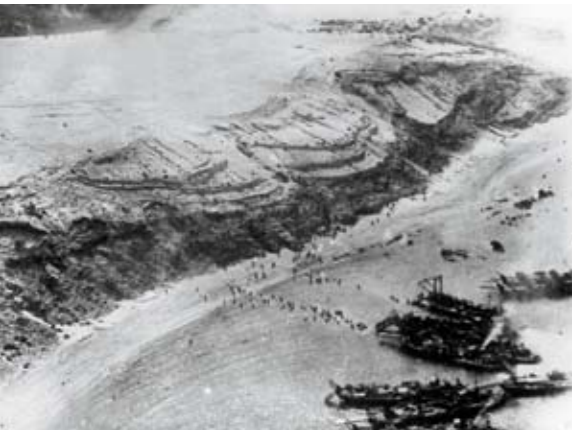
Vista aérea de las lanchas K varadas demasiado lejos, los infantes acercándose a la playa, agua al cuello, y los fuertes desniveles de la costa.

La guerra de Marruecos se hizo a su favor, no en su contra. Se quería devolver al Sultán la viabilidad de su Estado, que no tenía, y que con sus medios no lograba. En la Conferencia de Algeciras de 1906, con Marruecos como parte interesada, nacieron los Protectorados español y francés. Las cabilas rebeldes al Sultán también se opusieron a ellos y hubo que derrotarlas a costa de mucha sangre y mucho oro españoles