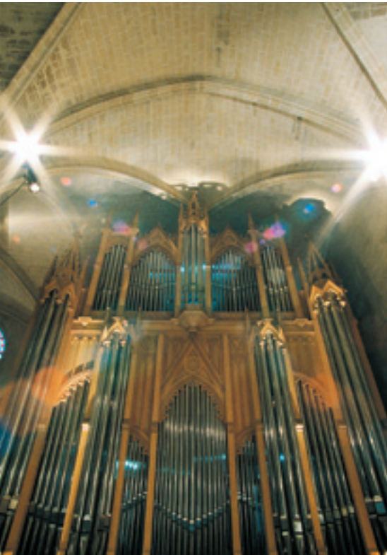
L'orgue Cavallé-Coll dans le réfectoire de l'abbaye • michel chassat • Royaumont 2009