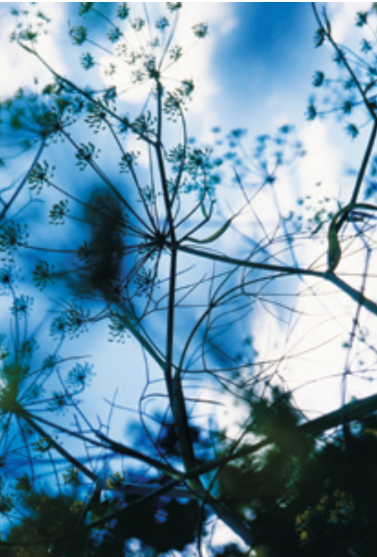
Foeniculum vulgare (fenouil commun), jardins des 9 carrés • michel chassat • Royaumont 2004