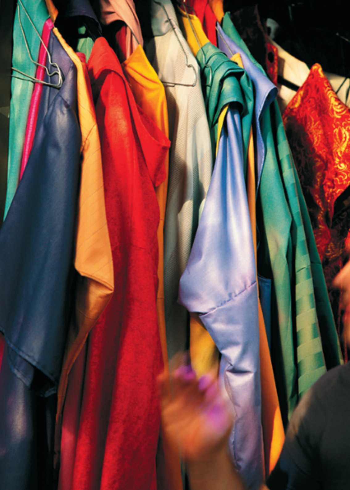
costumes et costumes, La Bourgeoise Gentilhomme - michel chassak - royaumont 2004