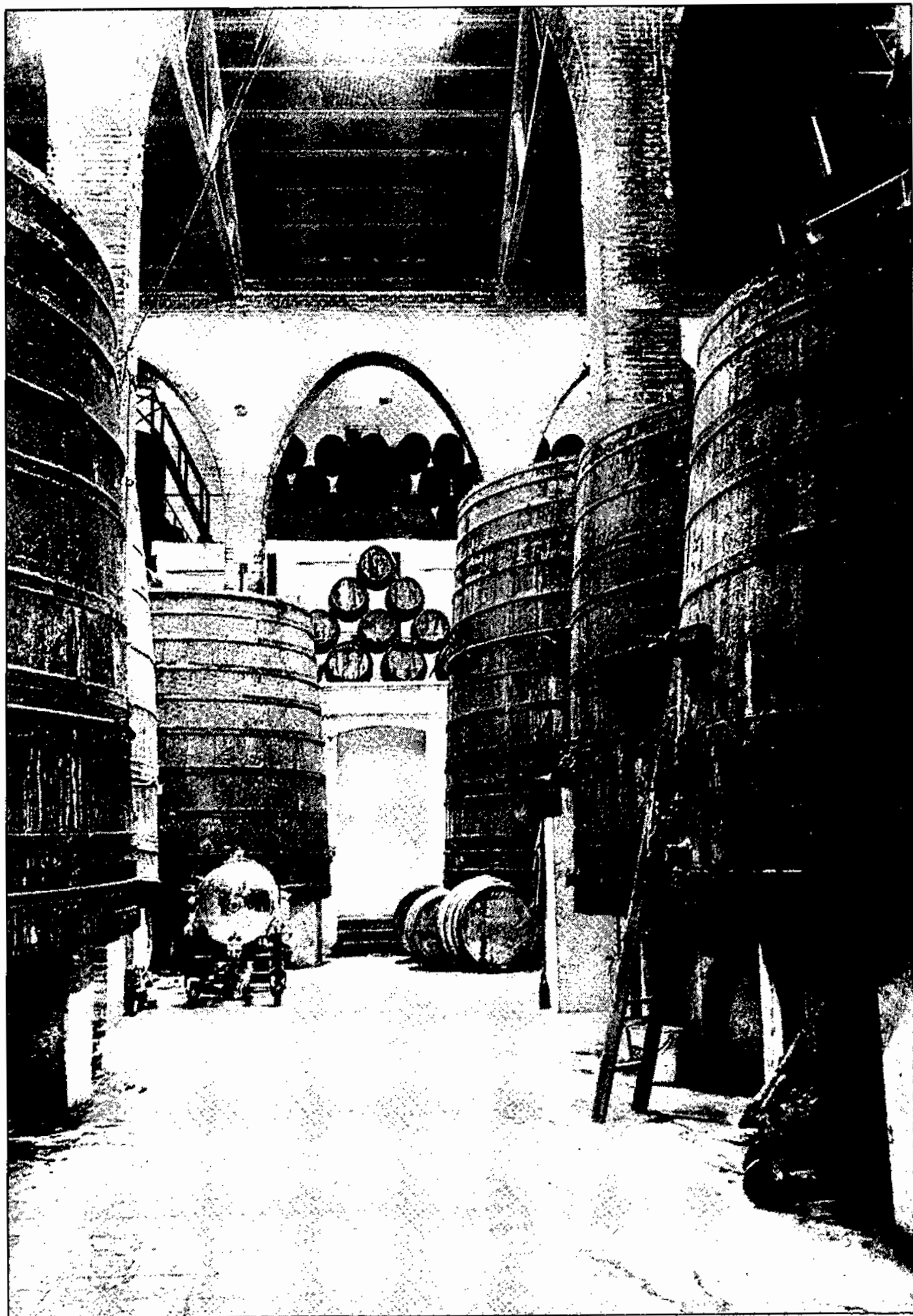
Interior de la Cooperativa Vinícola d'Alella.