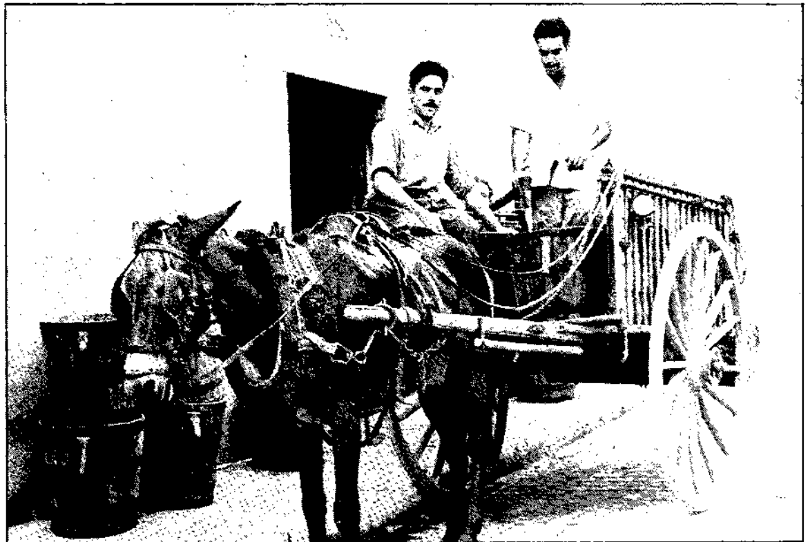
Cap a casa.

Mataró era una de les zones més riques de la comarca en la producció de vi. L'any 1935 es comptaven 63 cellers. Can Palauet, Can Plana, Can Vergada, Can Palau, Can Martí, Can Cusachs... eren, entre altres, els de més anomenada. Restaven ubicats, generalment, al bell mig de la ciutat, en els carrers més centrals: carrer de la Concepció, Plaça Xica, carrer d'en Palau, la Riera, carrer d'en Pujol, camí Ral... Solament al carrer de Santa Teresa n'existien quatre.