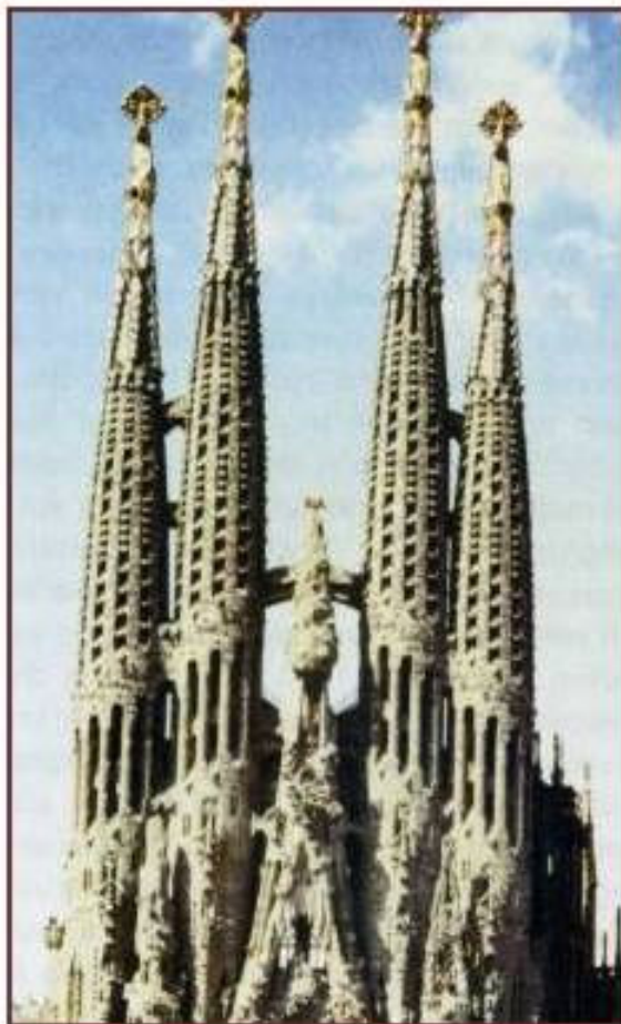
Antoni Gaudí ret homenatge de Catalunya a Déu, tot alçant les quatre barres de la bandera catalana cap al cel.

L'entusiasmava fer conjunts a base de quatre campanars per produir inconscients evocacions de les quatre barres (en totes les orientacions), que interpretades així adquirien una força sumptuosa i glorificadora.