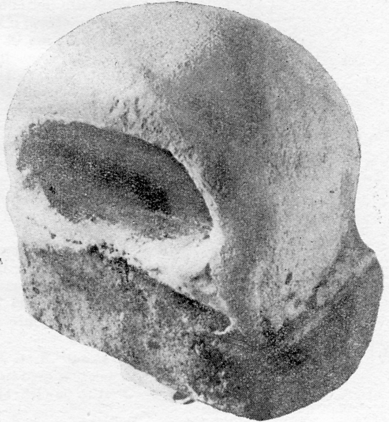
Fig. 3. Musée de Plovdiv.