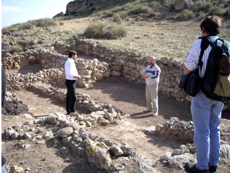
VISITA DE MIEMBROS DE LA FUNDACIÓN ADENDIA A LA EXCAVACIÓN

En la primavera de 2006 Fundación Adendia se puso en contacto con varios asesores científicos para que les aconsejaran acerca de los posibles proyectos a desarrollar en la Región de Murcia. No se buscaba un período cultural concreto, por lo que se trabajó en la elaboración de una relación de yacimientos cuya cronología abarcaba desde la época prehistórica hasta la etapa medieval y que se localizaban en diferentes comarcas, desde el Altiplano hasta el Campo de Cartagena. Después de conocer a fondo las iniciativas arqueológicas planteadas, se organizó una primera visita a uno de los yacimientos de la lista, el poblado ibérico de Coimbra del Barranco Ancho (Jumilla), uno de los conjuntos arqueológicos más importantes del Patrimonio Histórico y Artístico de nuestra península.