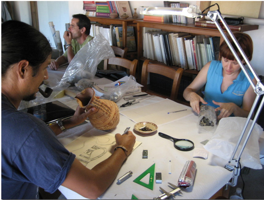
TRABAJOS DE DIBUJO EN EL LABORATORIO

Se ha inventariado todos los materiales arqueológicos recuperados en Coimbra del Barranco Ancho durante las campañas de excavación desarrolladas entre 1998 y 2005, dibujando aquellas piezas más interesantes desde un punto de vista científico y estético. Esto ha conducido a la elaboración de un completo conjunto de láminas, en las que se han agrupado las piezas de cada ajuar funerario, por un lado, y aquellas que tuvieran alguna relación directa con él. En este trabajo, tras un primer paso de dibujo a mano, se han utilizado programas informáticos como Corel Draw 12 o AutoCad 2007.