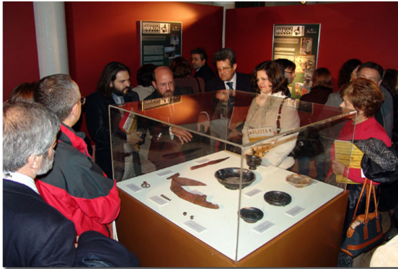
EXPOSICIÓN TEMPORAL EN EL MUSEO DE LA UNIVERSIDAD DE MURCIA

Todo esta inyección de aire fresco ha hecho que nuestros esfuerzos se renueven y que perviva el espíritu que comenzó hace treinta años y que sigue igual de fuerte y con unas fuerzas renovadas que gracias a la Colaboración de la CARM, el ayuntamiento de Jumilla y la Fundación Adendia podemos en un breve periodo de tiempo estar hablando de un centro de interpretación del Mundo Ibérico en Jumilla y porqué no, plantear en un futuro cercano la creación de un Instituto de Estudios Ibéricos en la Región de Murcia.