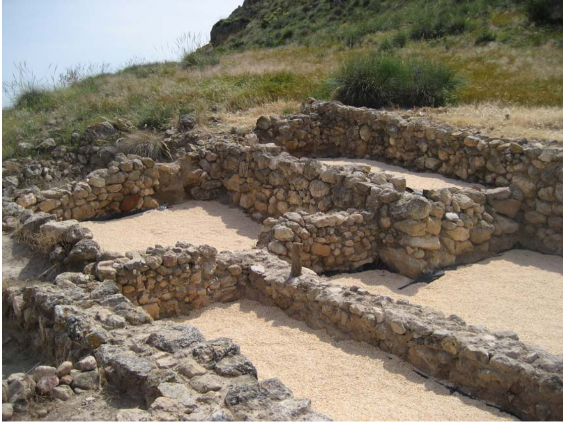
PARTE DE LA EXCAVACIÓN TRAS EL PROCESO DE RESTAURACIÓN

manipulaciones posteriores en el momento de su estudio y exposición al público.