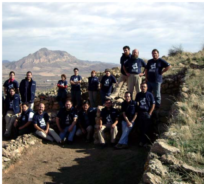
EQUIPO DEL PROYECTO ÍBEROS DE LA CAMPAÑA DE 2006

Todo esta inyección de aire fresco ha hecho que nuestros esfuerzos se renueven y que perviva el espíritu que comenzó hace treinta años y que sigue igual de fuerte y con unas fuerzas renovadas que gracias a la Colaboración de la CARM, el ayuntamiento de Jumilla y la Fundación Adendia podemos en un breve periodo de tiempo estar hablando de un centro de interpretación del Mundo Ibérico en Jumilla y porqué no, plantear en un futuro cercano la creación de un Instituto de Estudios Ibéricos en la Región de Murcia.