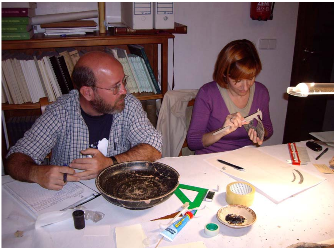
TRABAJOS DE INVENTARIO

Esta fase va indiscutiblemente ligada a un trabajo exhaustivo de laboratorio: lavado de los materiales recuperados, inventario, dibujo de objetos de interés arqueológico, restauración de piezas, análisis osteológicos, antracológicos, carpológicos y antropológicos, etc. cuyos resultados se plasmarán en su Memoria correspondiente.