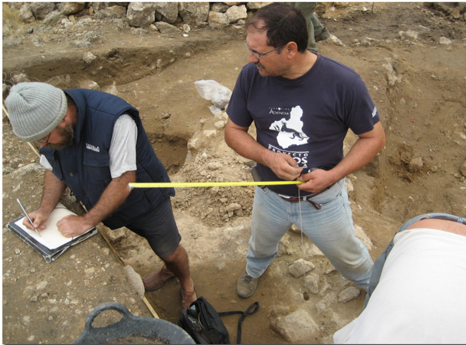
PROCESO DE EXCAVACIÓN EN LA CAMPAÑA DEL 2007

El siguiente paso fue la definición del proyecto, marcando los objetivos y el calendario de actuaciones. Se definieron tres líneas de actuación: publicación de una Monografía que recogiera las actuaciones desarrolladas en Coimbra del Barranco Ancho entre 1998 y 2005, excavaciones de campo del yacimiento, y por último, la preparación de una exposición temporal acerca de los descubrimientos de dicha campaña de excavación. El diseño de una página web se concibió como una forma de seguir día a día todos los pasos del Proyecto Iberos que con tanta ilusión se concibió.