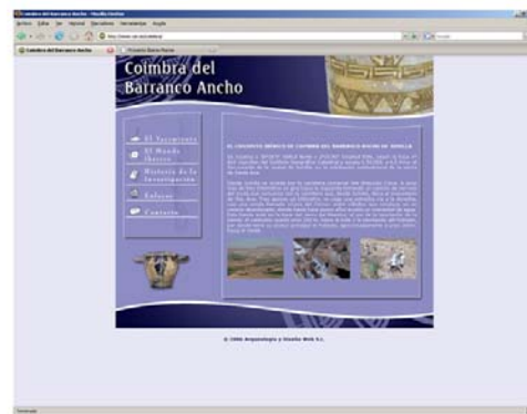
SITIOS WEBS DE PROYECTO IBEROS MURCIA Y COIMBRA DEL BARRANCO ANCHO