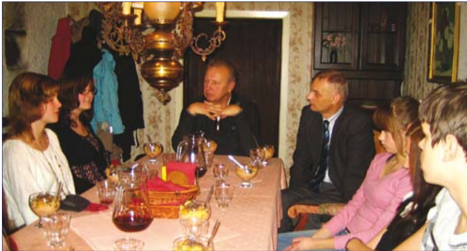
Rapla Sõprade Klubi juhatus ühisel õhtusöögil noortega.