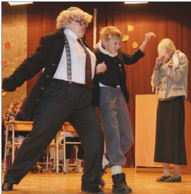
Alu kooli juubelil etendati 4 pilti Oskar Lutsu „Kevadest“.