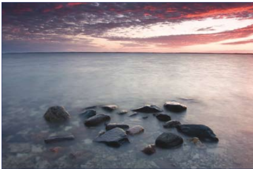
Päikeseloojang Saarnaki laiul lõunatipus.

Saarnaki üheks võludest on elektri puudumine. Pole kraanivett ega kanali-