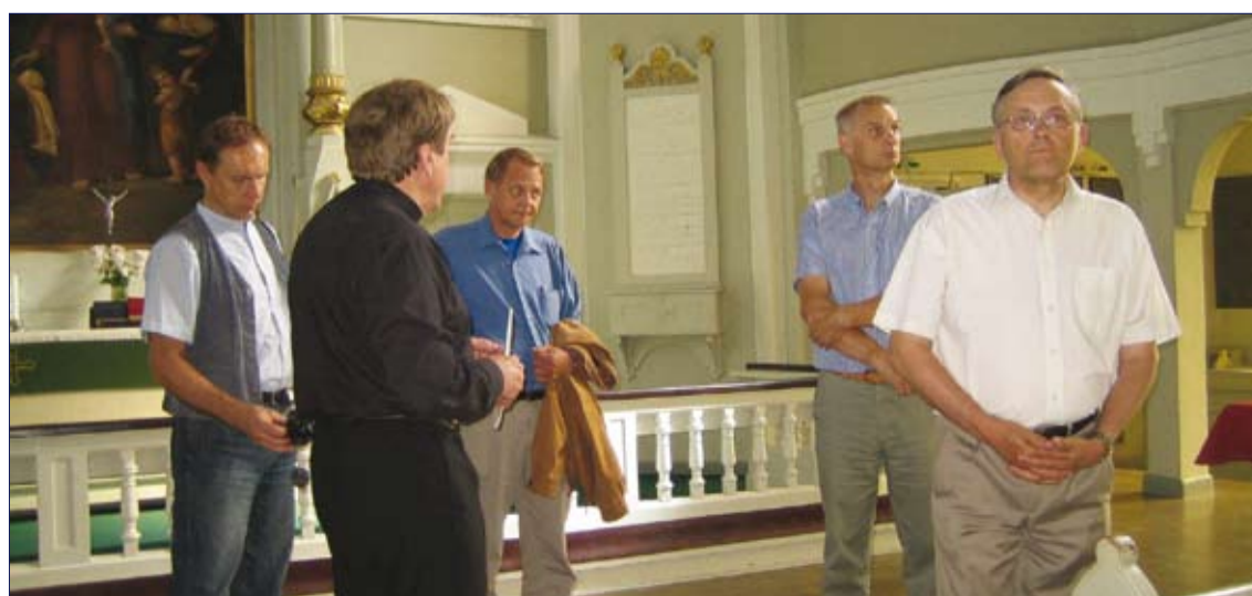
Külaskäik Kauhava kirikusse.

Soovime uuele sõprusvallale Kauhavale järgmiseks aastaks palju edu! RT