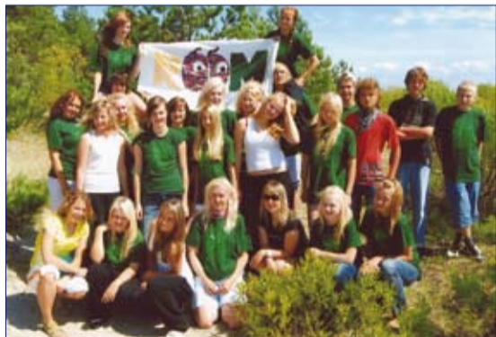
Rapla malevlased kokkutulekul Pärnus.

Nii see noor inimene, tihti pärit paneel- majast ja ilma tõise suhtlemiseta maal elavate vanavanematega õpibki alles malevas reha ja labidat hoidma, istutama, hekki piirama, teistega koos olema, esi- nema, mängima ja võistlema. Kerge see ei ole.